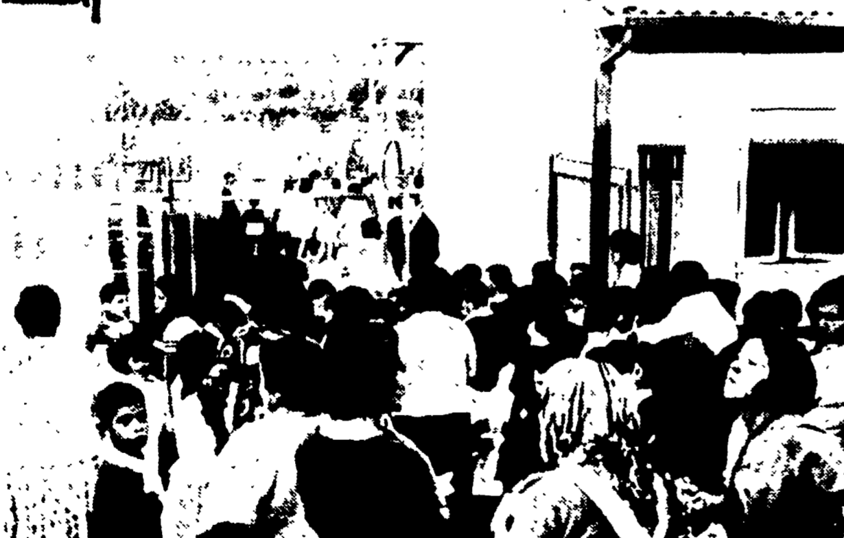
A Rebibbia e a Ponte Mammolo centinaia di bambini non hanno ancora potuto andare a scuola per mancanza di aule. Ecco un aspetto della manifestazione di protesta inscenata ieri mattina dalle donne di Rebibbia dinanzi alla scuola.

Filobus fermi per ore, o costretti a procedere a passo d'uomo; nodi di traffico completamente intasati; sconvolgimento degli orari di tutta la rete dell'ATAC, con seri danni per decine di migliaia di persone.