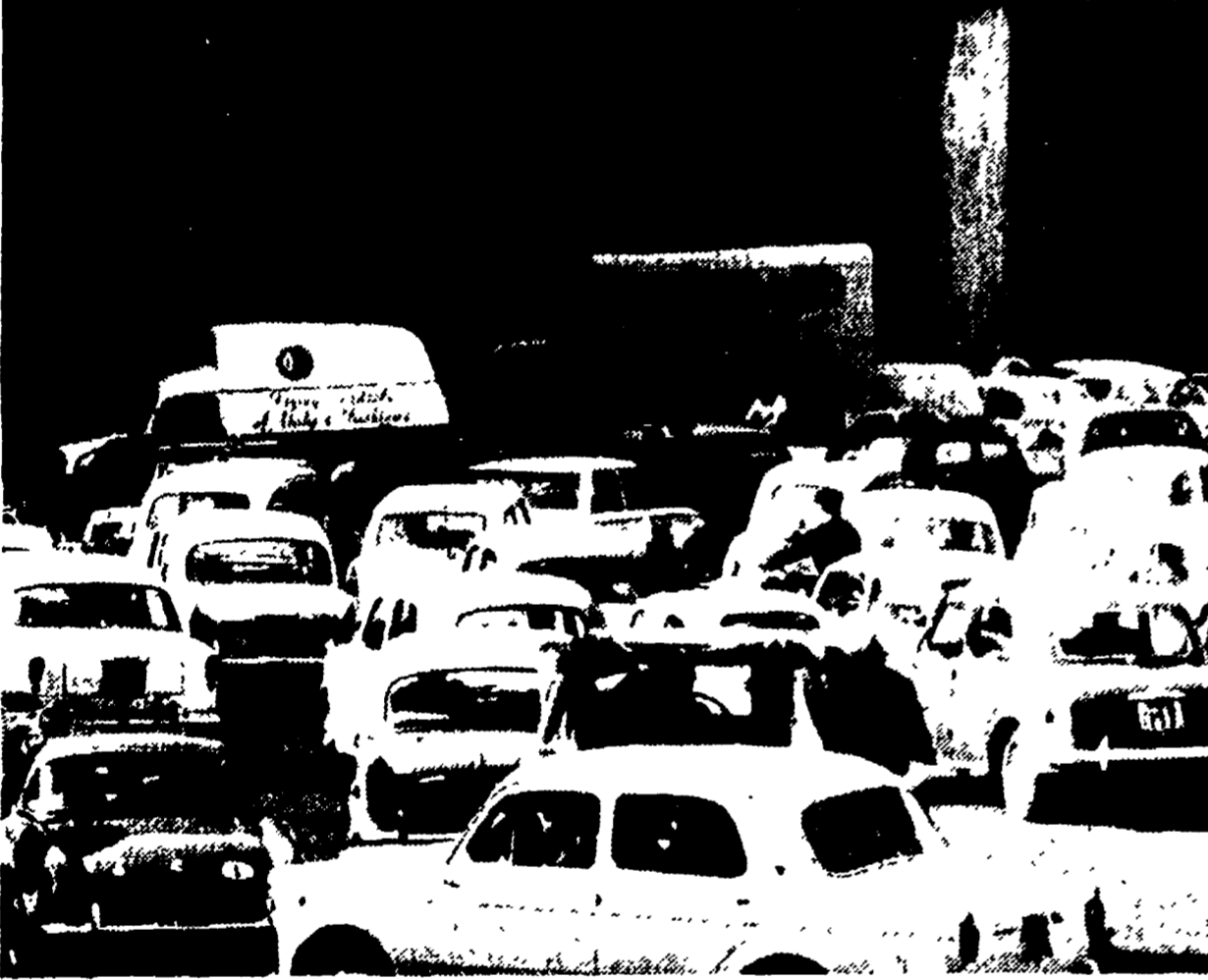
Un aspetto del caos del traffico di ieri mattina: piazzale Sisto V intasato dalle automobili. Ingorgi del genere si sono verificati in una buona metà del centro.

Si è stato sufficiente un funerale a paralizzare il centro della città per ore ed ore. Con un lungo corteo, ieri mattina è stato portato l'estremo saluto al generale Silvio Napoli. Un fatto normale e consueto, che tuttavia è bastato a gettare nel caos traffico e trasporti pubblici.