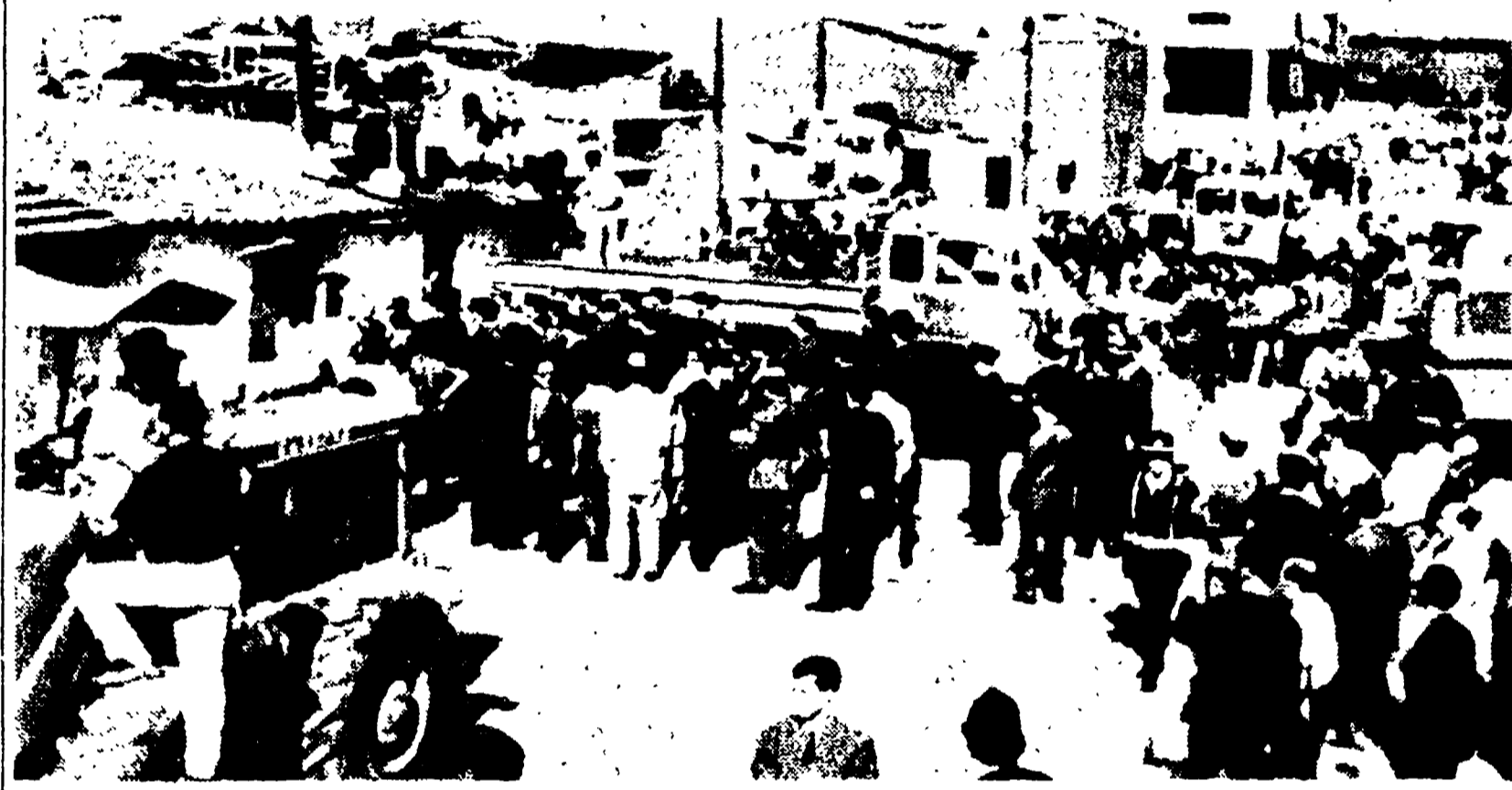
PALERMO, 18. - Alle nove di questa mattina ha avuto inizio lo sgombero delle casupole abusive sorte subito dopo la guerra in una vasta zona spianata dai bombardamenti nella via Francesco Crispi, antistante il porto di Palermo.