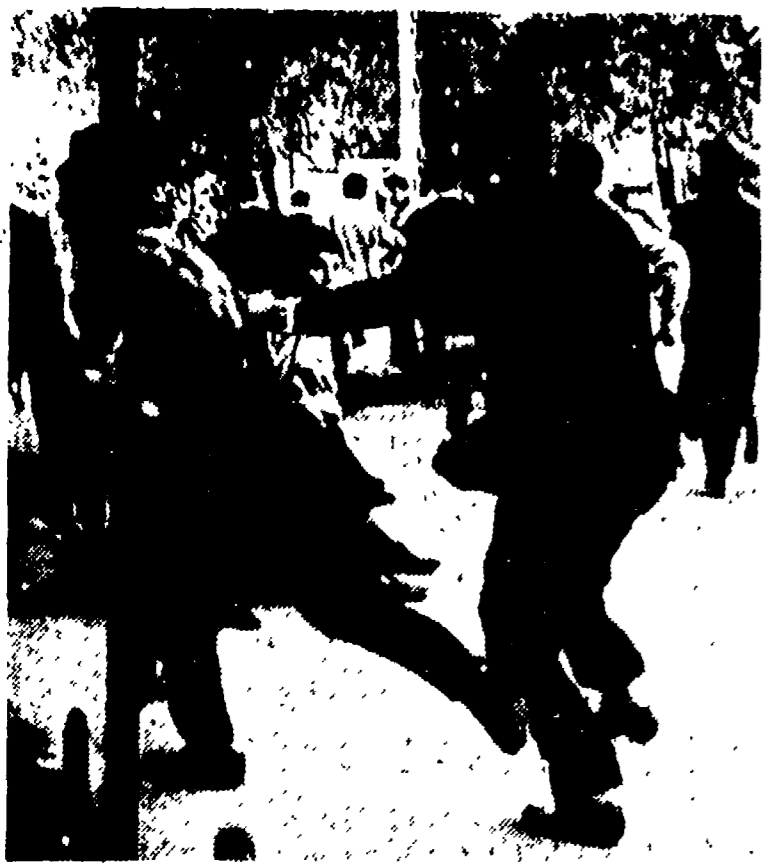
Gli studenti caricati dalla polizia