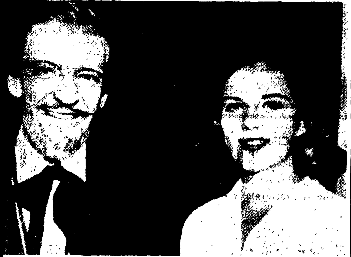
HOLLYWOOD - Fred Astaire, stranamente truccato per le esigenze di uno spettacolo televisivo, insieme con la giovane figlia Ava, l'attore ha compiuto l'assolutamente anni...

« West Side Story » è un'eccezione che conferma la regola - Tra il cinema e la TV, il simpatico protagonista di tanti film trova anche il tempo per scrivere libri - Le interpretazioni più recenti