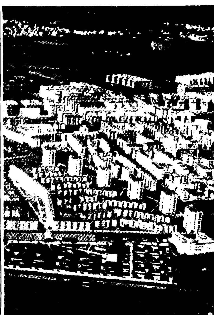
La drammatica crisi dei trasporti che è esplosa a Roma nelle proteste contro gli aumenti, ripropone innanzitutto il problema dello sviluppo caotico della città...

Nonostante la violenta pioggia abbattutasi sulla città Imponente manifestazione per la pace a Genova Appello alla solidarietà con il popolo algerino