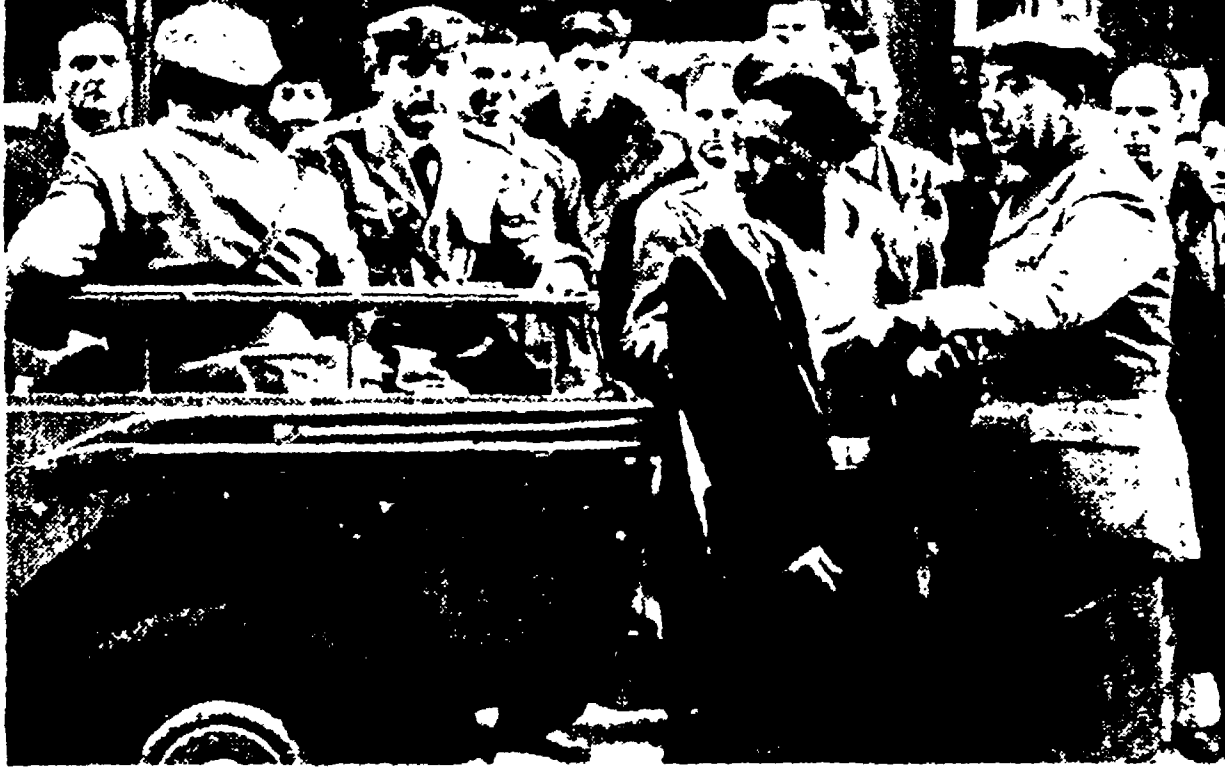
Indignazione razzista: tre negri sono stati aggrediti a Roma da gruppi di fascisti, appartenenti all'organizzazione "Giovane Italia", durante alcune manifestazioni di studenti per la tragedia morte del 13 aviatore italiano a Leopoldville