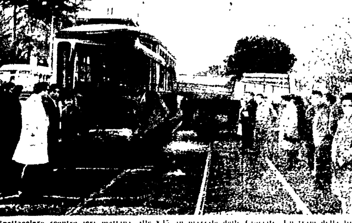
Spettacolare scontro ieri mattina alle 8.15 in piazzale delle Colonne. Un tram della linea «11» è sventrato violentemente con un camion bianchissimo improvvisamente mentre attraversava i binari. Cinque persone sono rimaste ferite, una è morta.