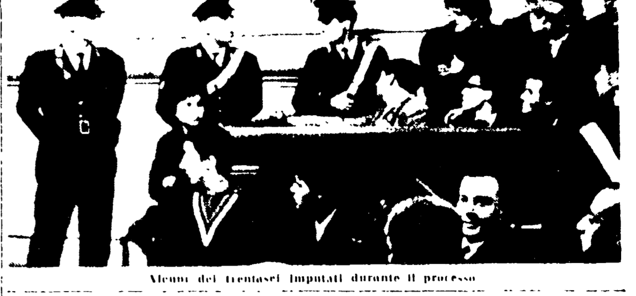
Alcuni dei trentasei imputati durante il processo

Le pene richieste per 34 imputati - Due assoluzioni - Le arringhe - Domani la conclusione