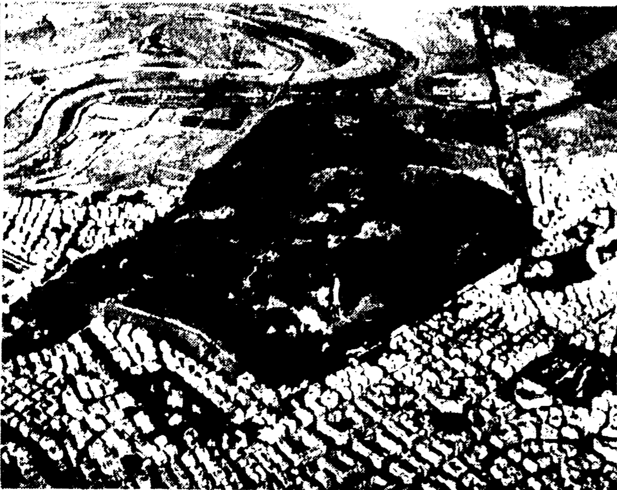
Villa Chigi dovrà essere destinata a parco pubblico, secondo quanto ha suggerito il Consiglio superiore dei Lavori Pubblici. Alcuni anni fa la Giunta democristiana aveva approvato la lottizzazione dell'area verde.