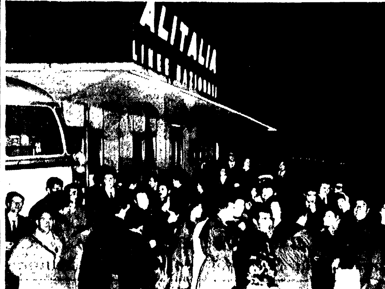
Applauditi gli scioperanti di Fiumicino. Sono 180 dipendenti di una ditta che gestisce i bar, i ristoranti e le mense dell'aeroporto...