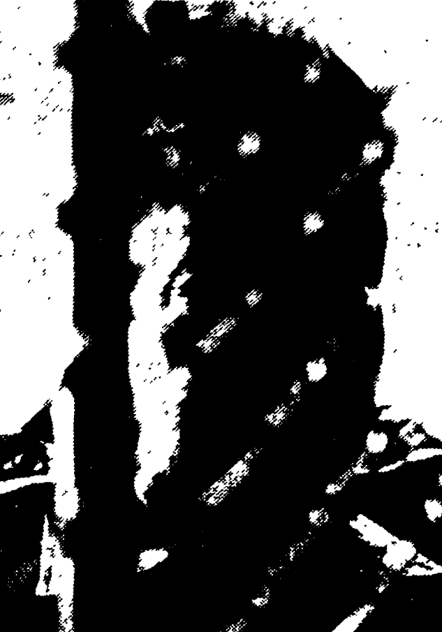
CITTA' DEL MESSICO - Si teme per la vita di David Alfaro Siqueiros, il grande pittore messicano che da quindici mesi è rinchiuso nelle prigioni della capitale...

Dichiarazione cinese sulla controversia con l'India