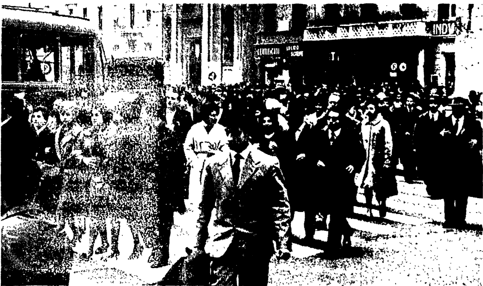
I dipendenti dei grandi magazzini manifestano al centro di Roma

Oggi e domani scioperano gli insegnanti di ogni ordine di scuole