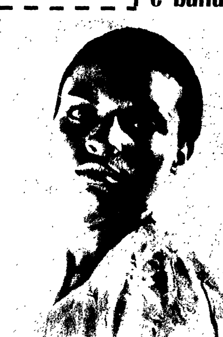
Charlie Chaplin è approdato sulle rive del Tevere proveniente da Hollywood e ha già partecipato a numerosi film...