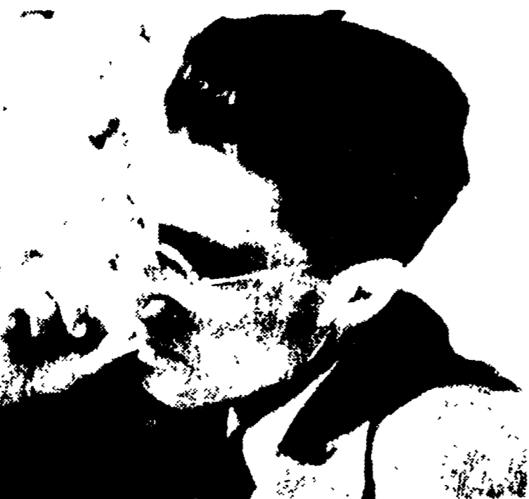
Alle 22,35 sul «Primo», va in onda il documentario su «La langhe di Cesare Pavese»