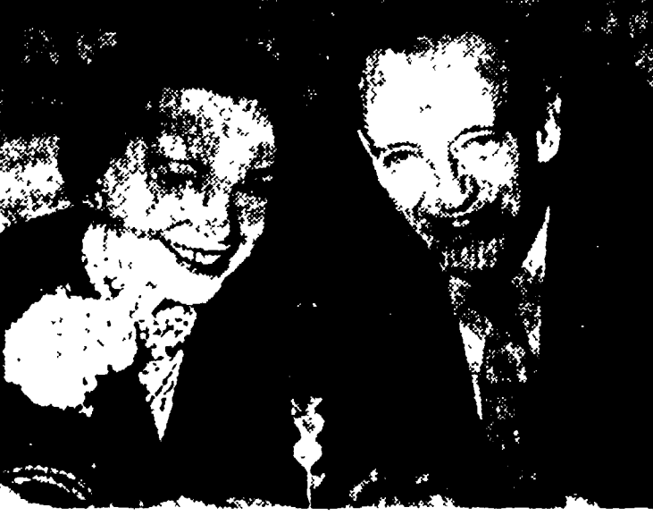
Fred Astaire (stasera sul secondo canale) fotografato insieme alla sorella Adele