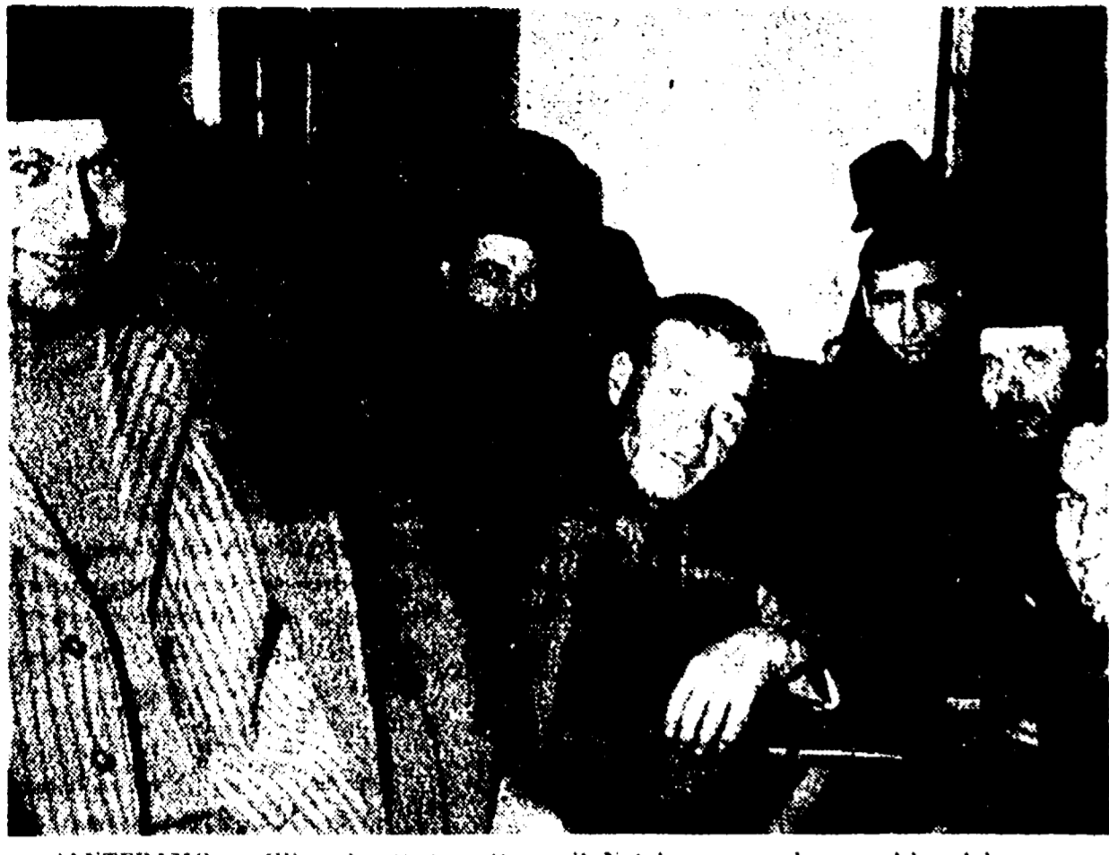
SANTERAMO — Gli emigrati, tornati per il Natale, passano le ore nel bar del paese

L'anno scorso auguri natalizi in tutte le lingue, ma non in italiano... - 50.000 lavoratori tornano dalla Germania e dalla Svizzera - I « vecchi » in viaggio - L'esperienza di una giovane tedesca