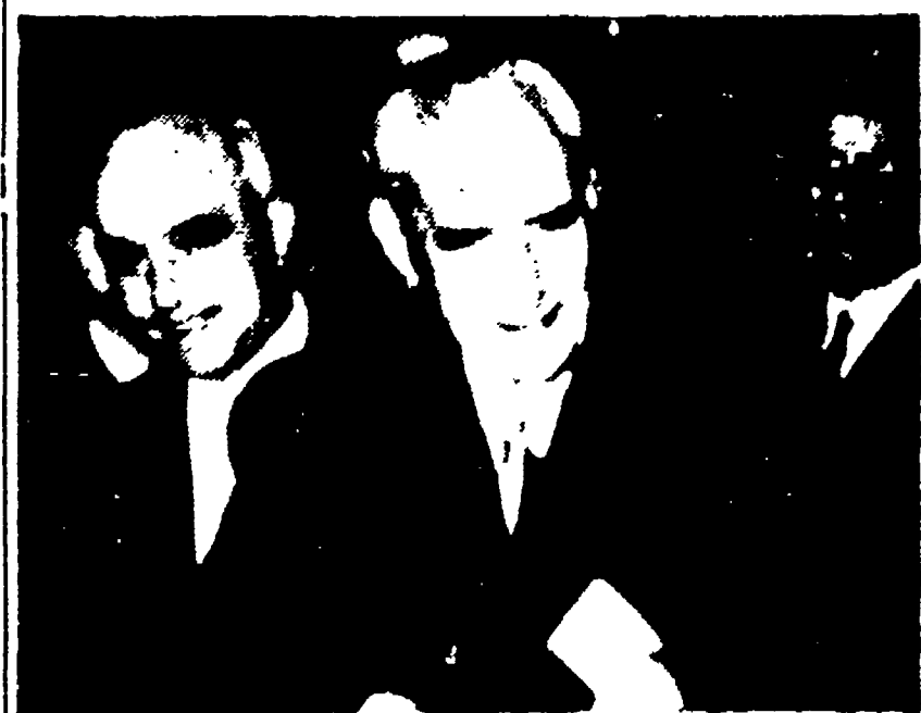
LISBONA - Il dittatore Salazar e (dietro) il ministro delle Interni Rodrigues dos Santos, cacciati dall'obiettivo il 12 novembre, giorno delle elezioni-truffa