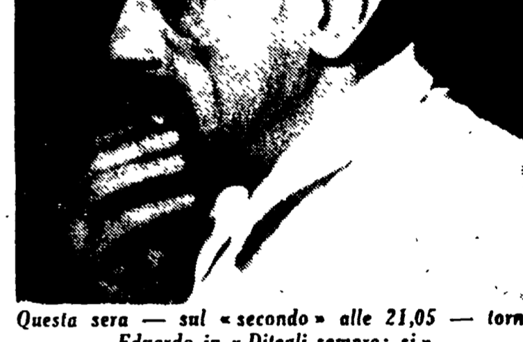
Questa sera - sul «secondo» alle 21,05 - torna Edaudo in «Ditegli sempre: sì»

Martedì 23, secondo concerto da camera con il violonista Isaac Stern, accompagnato dal pianista Alexander Zakin. In programma: la Ciaconna di G. B. Vivaldi; il Rondò di Mozart; Nigun di Bloch; Danze popolari rumene.