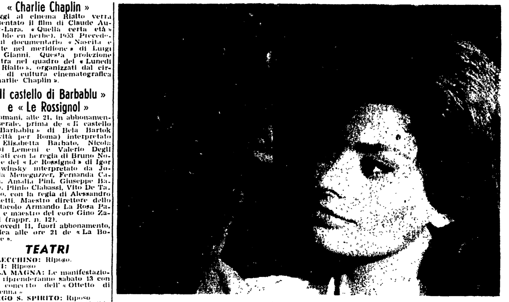
Charlton Heston e Sophia Loren, Rodrigo e Duja Jemena nel film «EL CID», una eccezionale rievocazione della vita e delle legendarie imprese dell'eroe che libera la Spagna dal Morl. El CID è un film di Anthony Mann, Supertechraram 70. E' prodotto dalla Dear Film, in associazione con Samuel Bronston e presentato dalla Dear Film Production.

PRIME VISIONI Adriano: Madame Sans Gêne, con S. Loren (ap. 15 ott. 22.30).