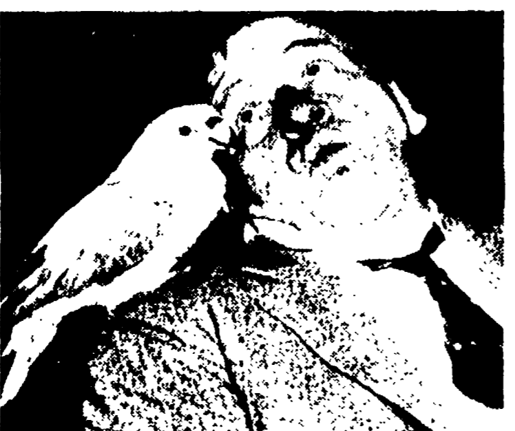
Wallace Beery comparirà stasera sul video (primo, ore 21,50) in « Quando il cinema non sapeva parlare »

Adriana Martino, sorella della più celebre Miranda, tornerà stasera sul secondo canale (ore 22,15) per interpretare arie del '600 e dell'800.