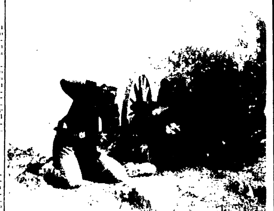
Vi ricordate la divertentissima interpretazione di Gasman... « I briganti italiani ».

8,30-15,10 Telescuola. 17,30 La TV dei ragazzi.