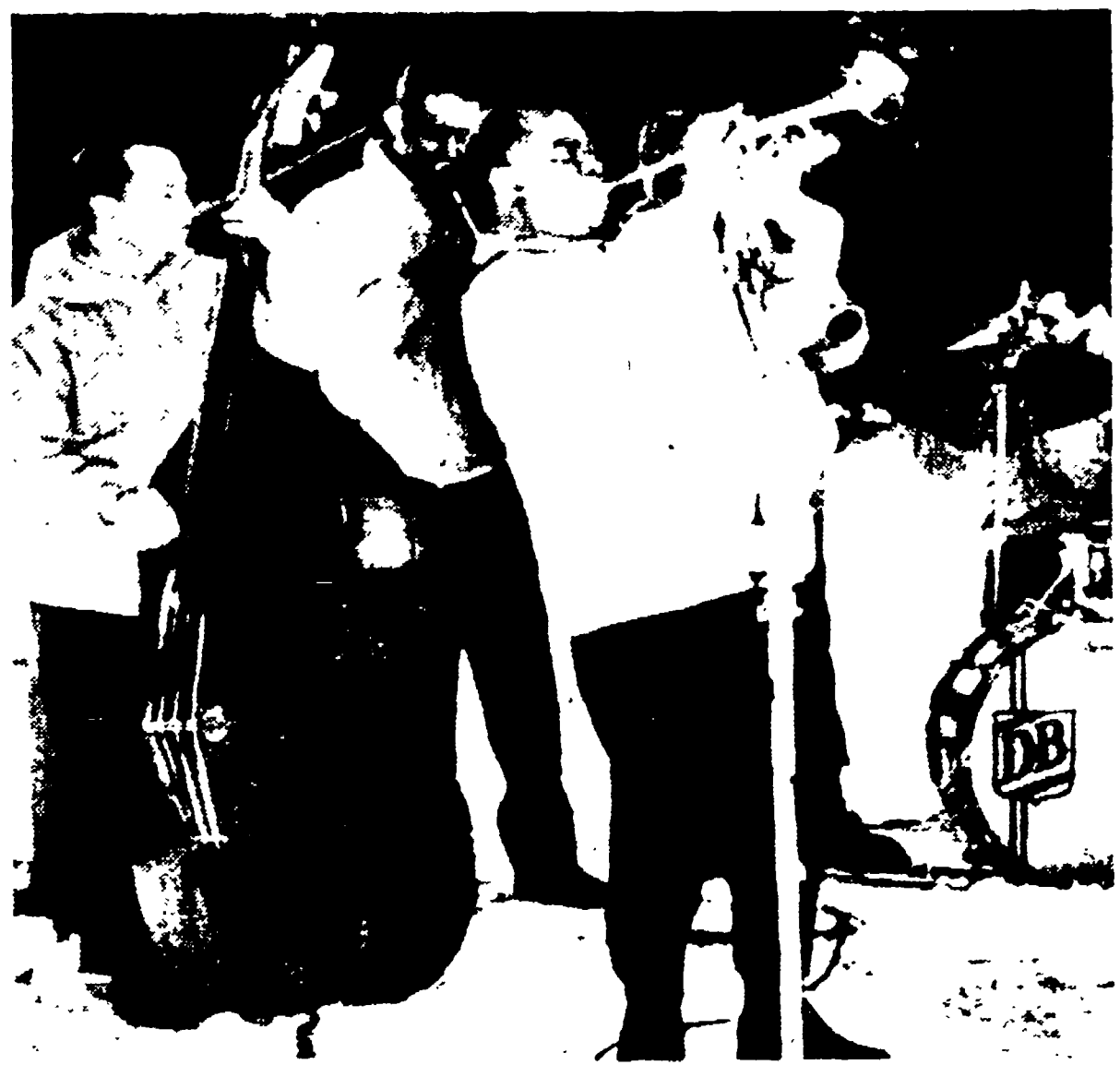
SUN VALLEY (Idaho) — Louis Armstrong suona la tromba sulla neve di Sun Valley davanti ai microfoni e alle telecamere della televisione americana... (text continues with a caption for the photo)

E' innocua come molti ritengono o è insidiosa?