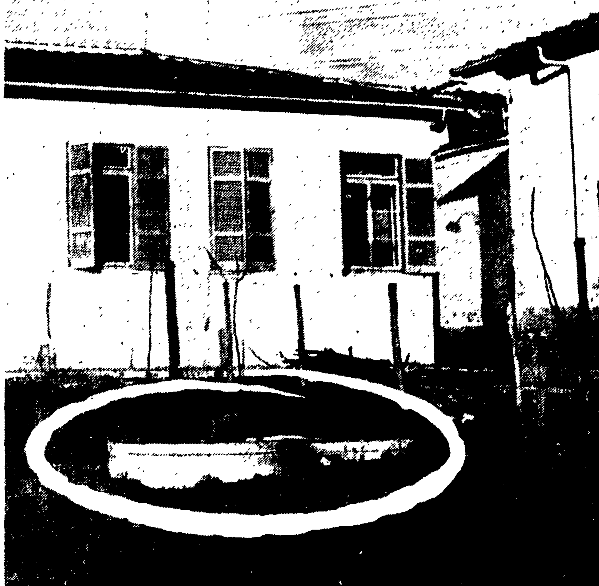
Il pozzo nero davanti alla scuola di Castelgiubileo

Un pozzo nero e acqua stagnante davanti alla scuola della borgata - Cinque bambini sono stati ricoverati al Policlinico