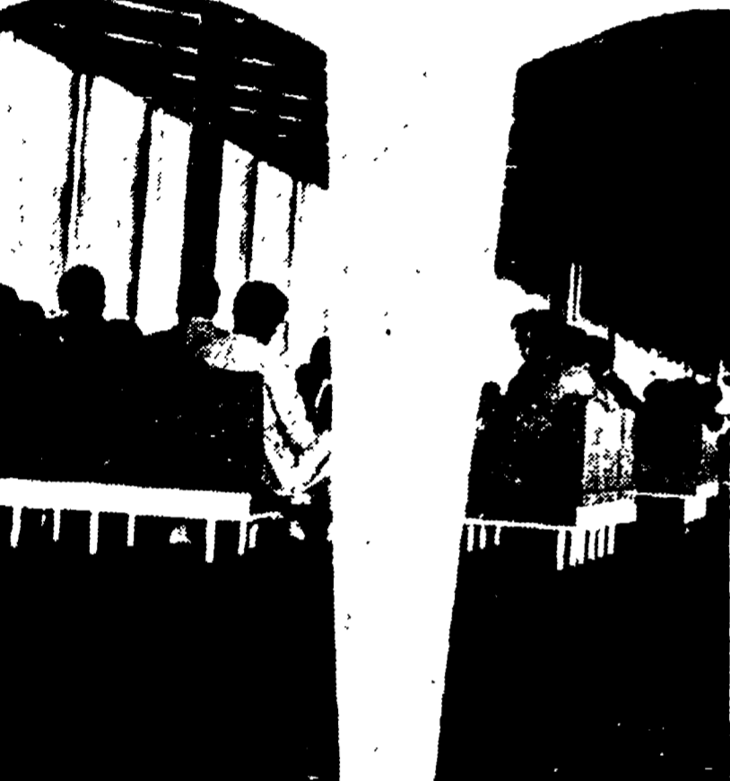
FIUMICINO — Le misure di sicurezza contro il vaiolo nello scalo Leonardo da Vinci: i viaggiatori provenienti dal Pakistan vengono isolati in una sala d'aspetto