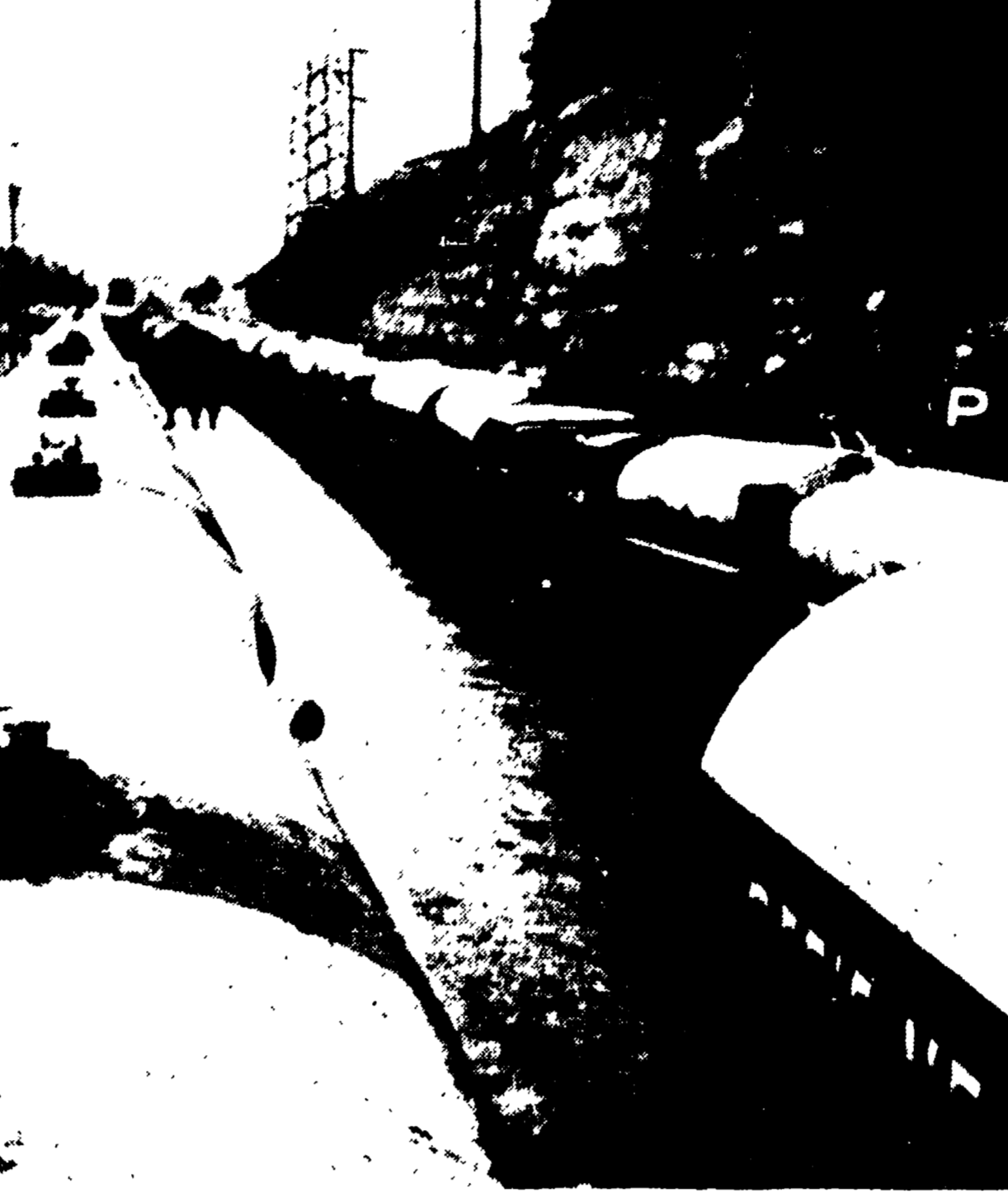
BOLZANETO — La lunga teoria di autocisterne che ha bloccato la cittadina (Telefoto)