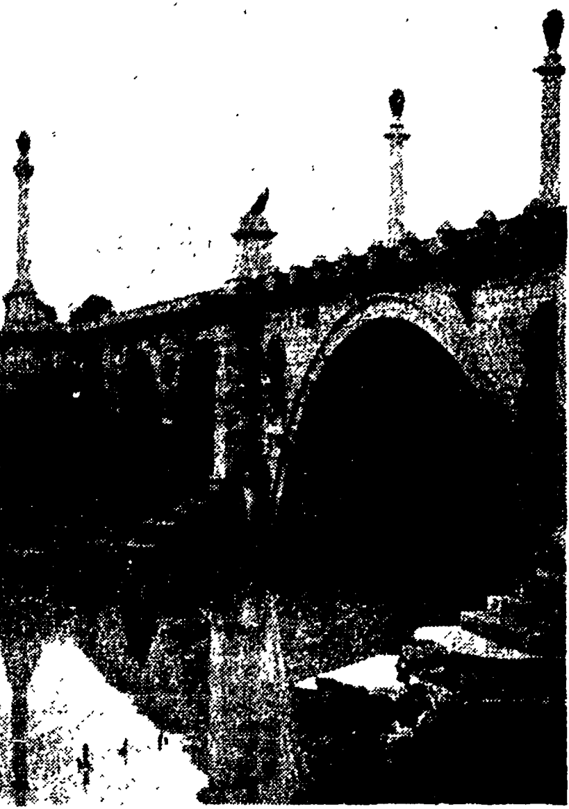
Nella fotografia in alto: un doppio « bailey » lanciato su un ponte di Firenze distrutto dalle bombe. La stessa soluzione sarà adottata per Ponte Flaminio, risparmiato dalla guerra ma non dai costruttori