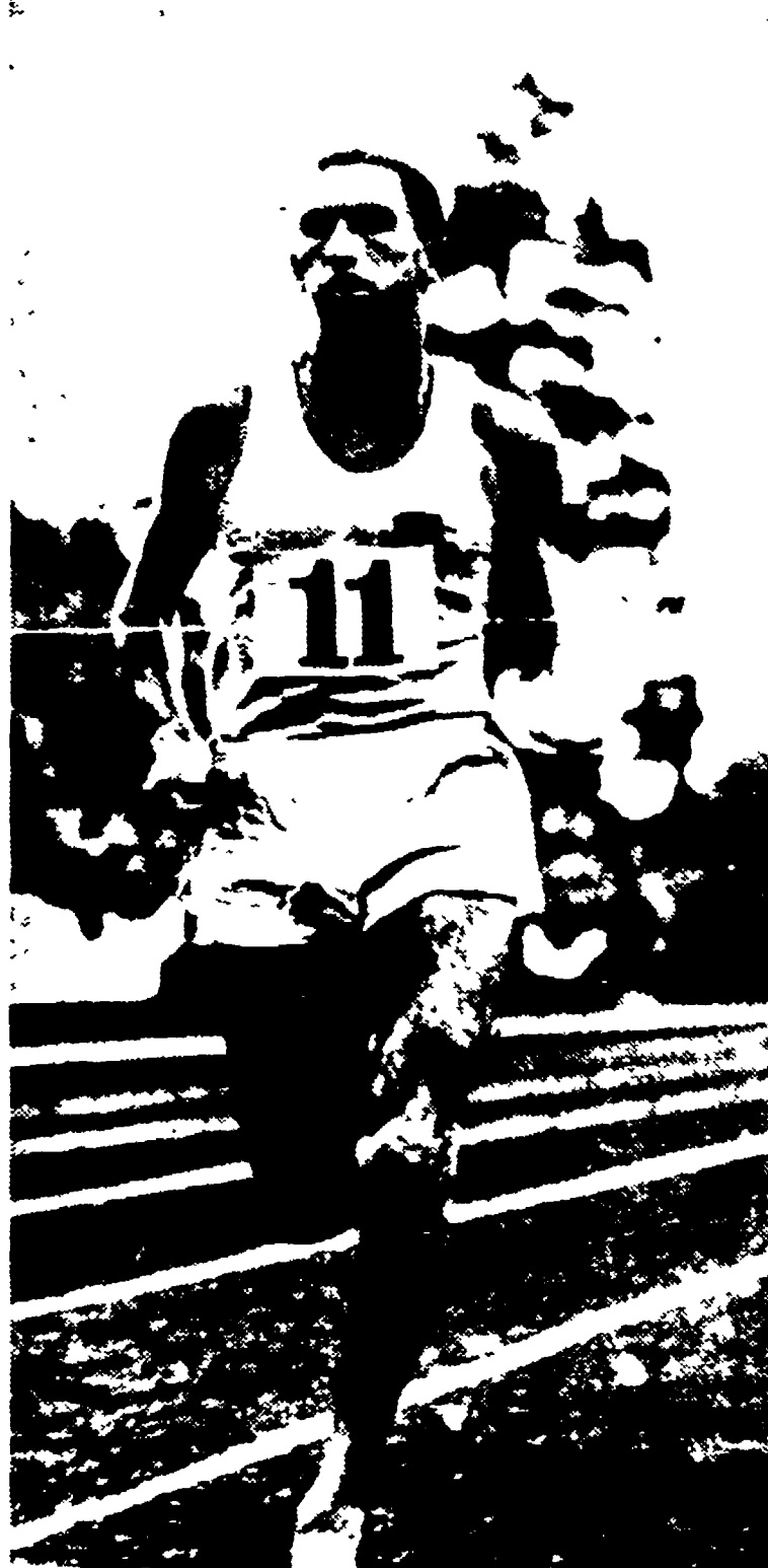
WELLINGTON, 27 - Il neo zelandese Peter Snell ha battuto il primato mondiale del miglio con il tempo di 3'54"4. Il precedente record che apparteneva all'australiano Herb Elliot dall'agosto 1958 è stato stabilito a Dublin, era di un solo decimo di secondo superiore, 3'54"5. Il nuovo primato assume maggiore importanza perché Snell ha corso su una pista erbosa, cioè una pista più frenante rispetto a quella in cenere, ai "Cocks Gardens" di Wanganui. Il britannico Bruce Tulloh è giunto secondo in 3'57"2 e lo australiano Albert Thomas terzo in 3'59"5. Il precedente miglior tempo sulla pista era stato realizzato in 3'55"6 da Herb Elliot nel febbraio 1958 a Perth. (Nella foto Herb Elliot).