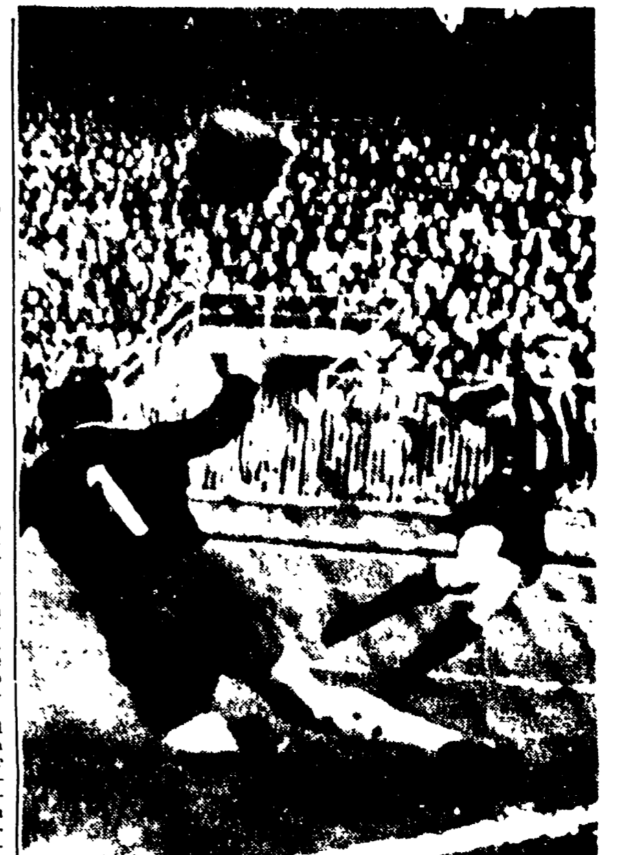
INTER-PADOVA 2-1. Primo minuto di gioco: Hittchen si apre la segnatura nerazzurra.