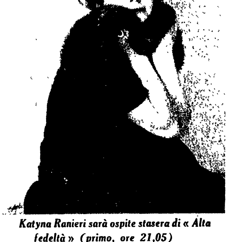
Katyna Ranieri sarà ospite stasera di «Alta fedeltà» (primo, ore 21,05)