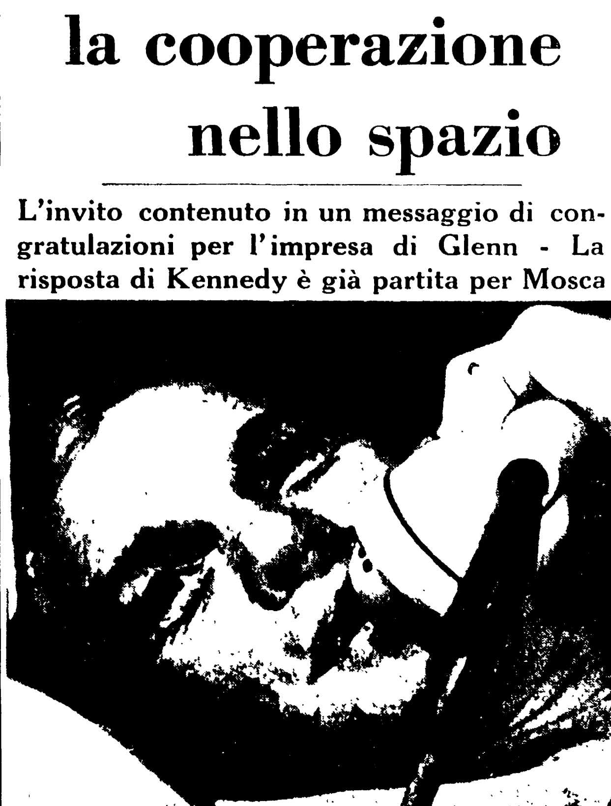
GRAND TURK (Bahamas) — John Glenn a bordo del cacciatorpediniere «Naos» parla al telefono col presidente Kennedy che lo ha chiamato direttamente dalla Casa Bianca

Giustizia: on. Luigi Gul (d.c.) Lavori Pubblici: on. Leone Fiorentino Sullo (d.c.) Agricoltura e Foreste: on. Mariano Rumor (d.c.)