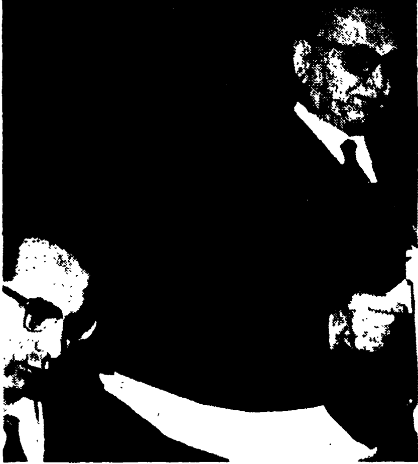
Il presidente della Confindustria Furio Cioegna mentre pronuncia la sua relazione. Gli è accanto il ministro Colombo, ieri confermato all'Industria.

Si è tenuta ieri mattina all'EUR l'assemblea annuale della Confindustria. Alla massima assise nazionale degli industriali erano presenti i ministri Pella e Colombo.