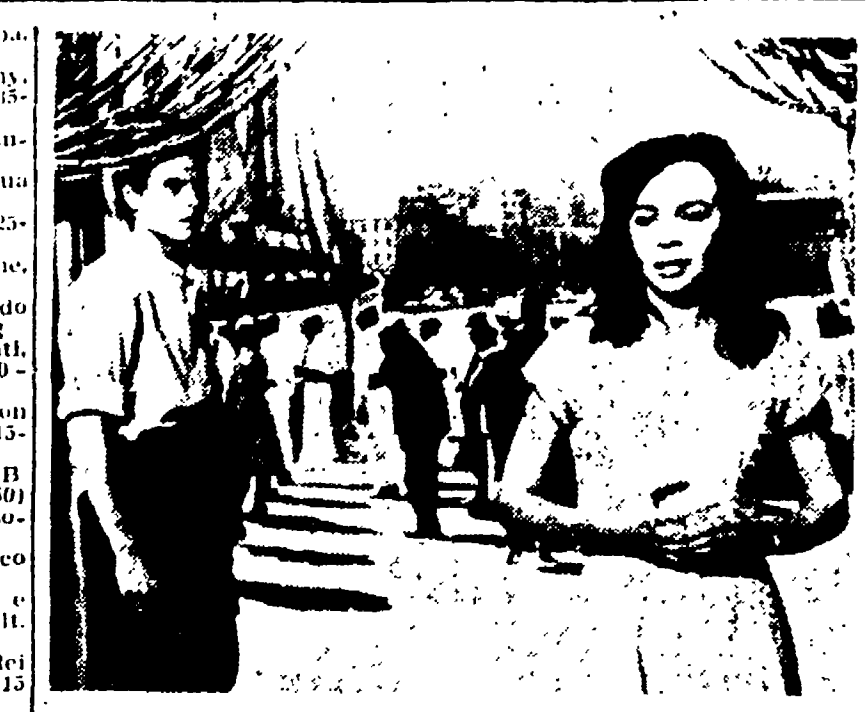
JOSHUA LOGAN che ha diretto «Plenio», «L'ermata d'antobus» e «Sayonara», è il regista di «FANNY» che al profeta con enorme successo in due grandi cinema della Capitale, «FANNY» per l'eccezionale regia e la mirabile interpretazione di tutti i suoi protagonisti è candidato a ben quattro premi OSCAR

Capranica: L'Idolo delle donne. Con J. Lewis. Capranica: L'Idolo delle donne. Con J. Lewis.