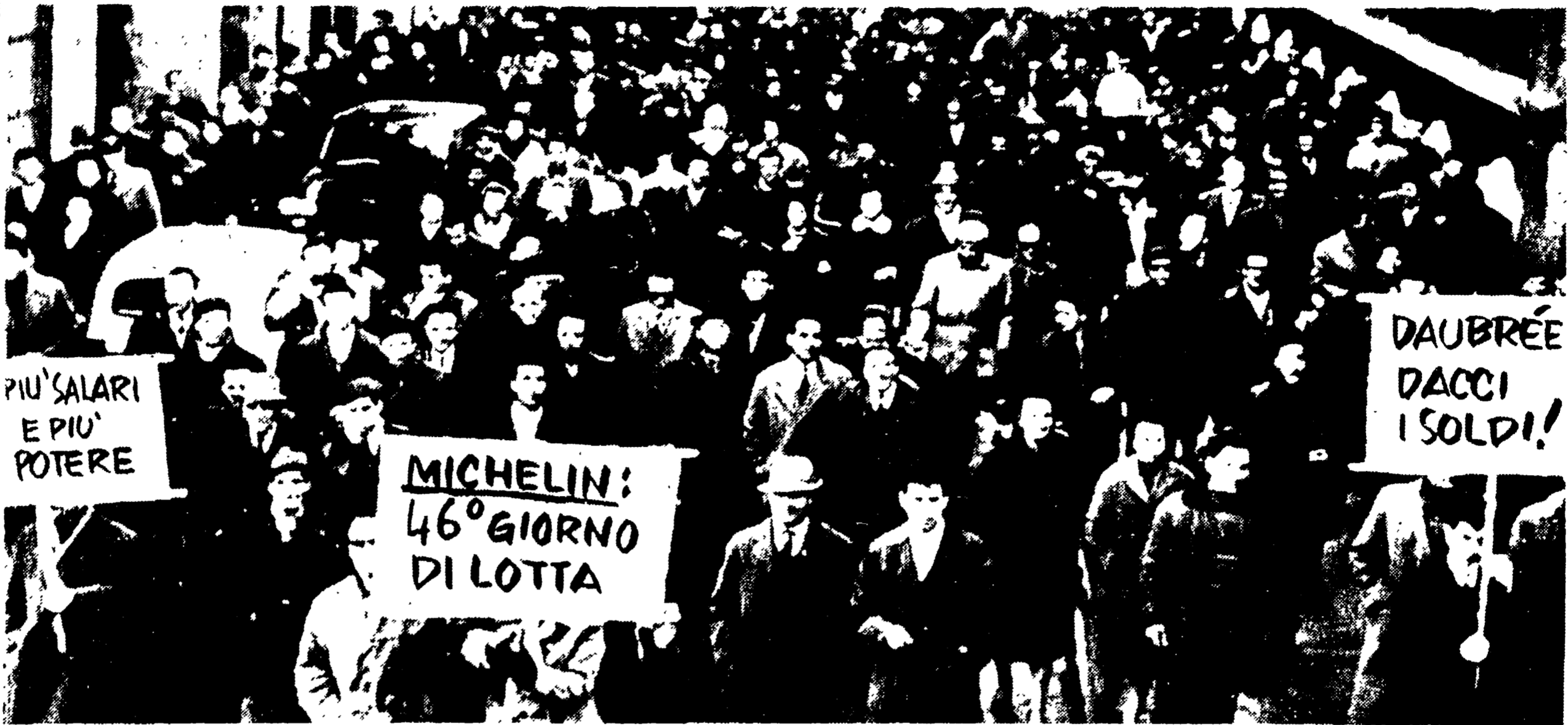
TORINO — I 3000 della Michelin, giunti al 46° giorno di lotta, hanno sfilato ieri per la città portando la loro vibrata protesta sotto le finestre della direzione