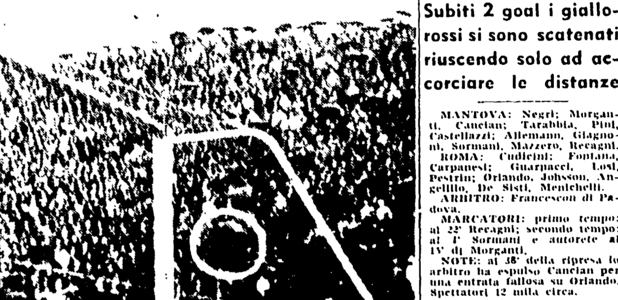
Subiti 2 goal i giallorossi si sono scatenati riuscendo solo ad acciacciare le distanze

MANTOVA. Negri, Morganti, Candelari, Tarabbi, Pini, Castellazzi, Altomanni, Giugnoni, Sormani, Mazzer, Recagni, ROMAN: Corderini, Fontana, Carpanesi, Guaracani, Lodi, Pestrini, Orlando, Johnson, Angelillo, De Sisti, Stentoni, e ARBITRO: Francesconi di Padova.