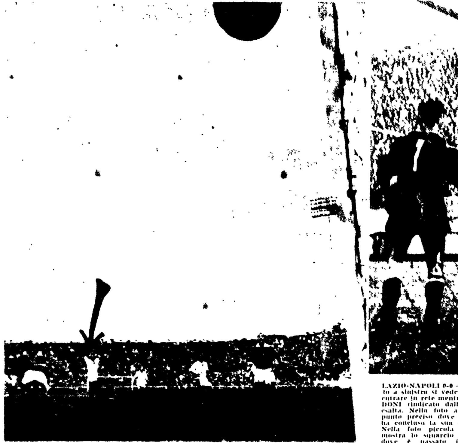
LAZIO-NAPOLI 0-0. Nella foto a sinistra si vede il pallone entrare in rete mentre SEGHEDONI (indicato dalla freccia) esulta. Nella foto a destra il punto preciso dove il pallone ha colpito la sua traversa. Nella foto in basso a sinistra si vede il pallone entrare in rete dopo un tiro di Rivera.