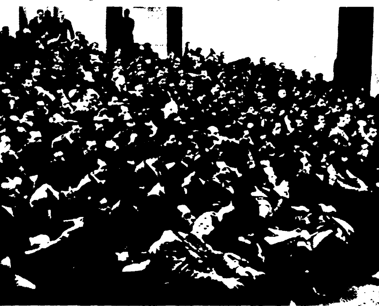
Un aspetto della sala del teatro Eliseo di Roma ove s'è svolto il convegno nazionale dei navalmeccanici

Riuscito il convegno F.I.O.M. - Rivendicata una nuova politica marinara - Le conclusioni di Novella