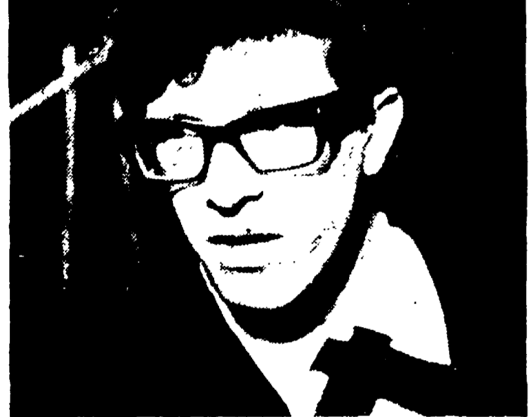
Peppino di Capri interpreterà alcuni « twist » in « Alta fedeltà » in onda stasera sul primo canale