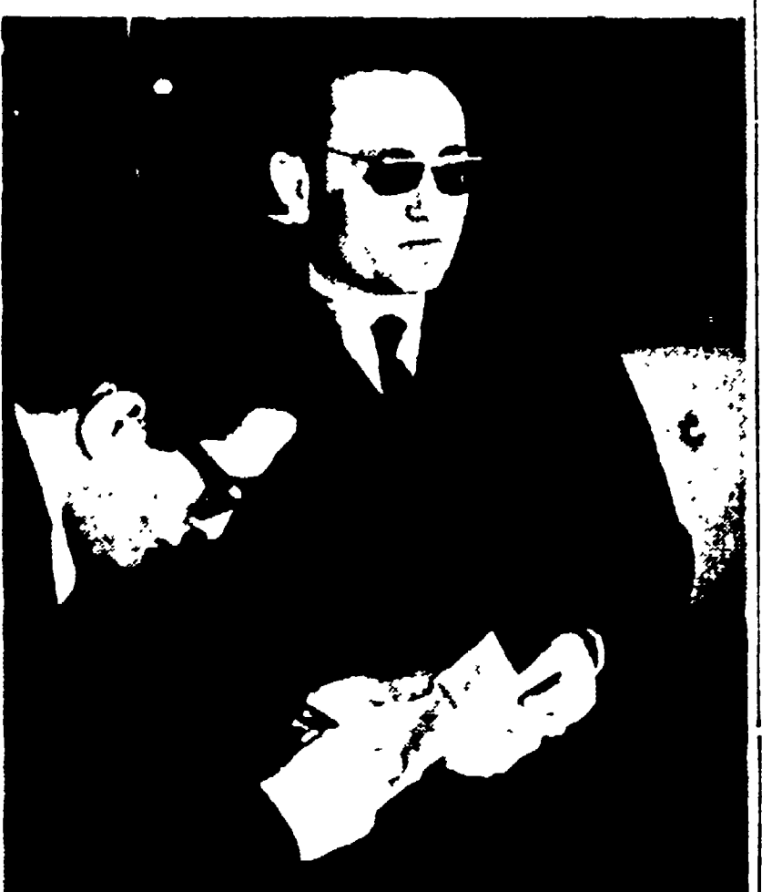
Ben Khedda durante la sua sosta a Roma, mentre viene intervistato dai giornalisti

Il premier algerino ha espresso la sua fiducia nell'appoggio del popolo italiano