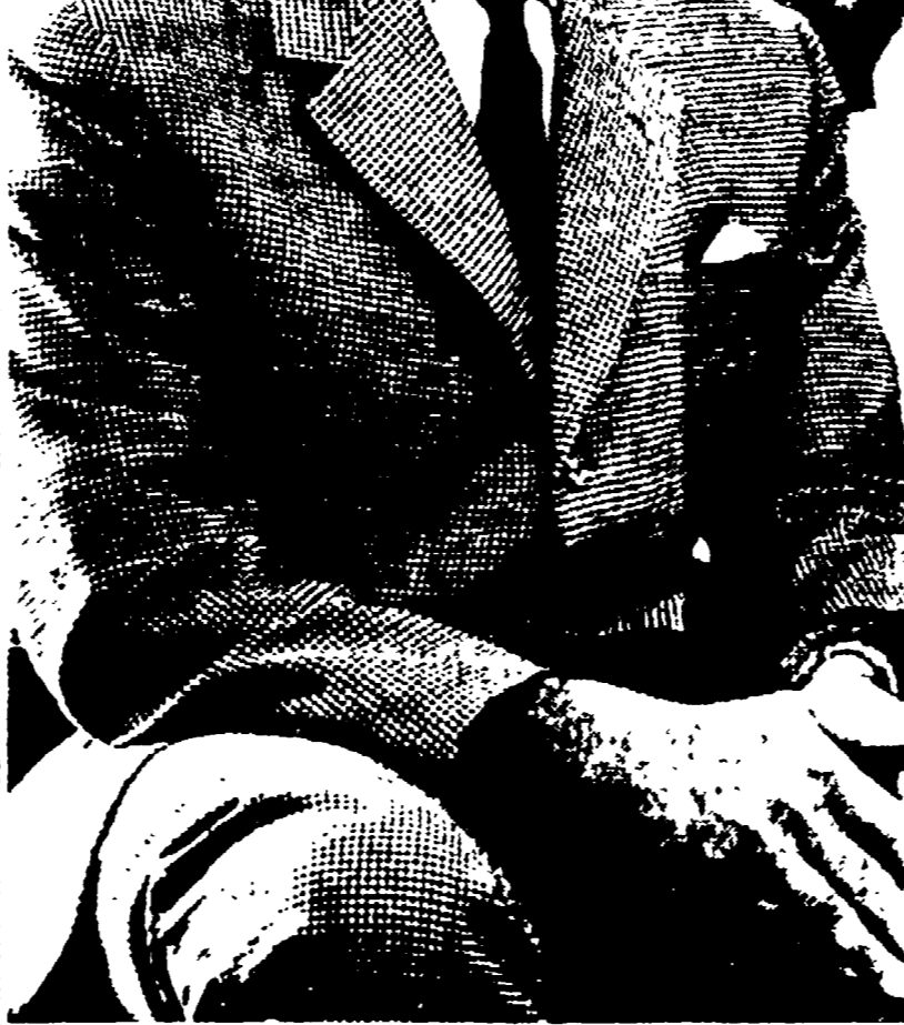
MADRID, 20. — La notizia delle dimissioni di Helento Herrera dal comitato a tre responsabile della conduzione della nazionale italiana che parteciperà ai campionati mondiali di calcio, ha creato un certo interesse in Spagna, dove si sta preparando la nazionale di calcio in vista della partita di calcio inamicizia con la nazionale spagnola che avverrà il prossimo 24 marzo a Madrid. Quando termineranno le competizioni ufficiali italiane, si dice che Herrera potrà venire qui e allenare i calciatori spagnoli.