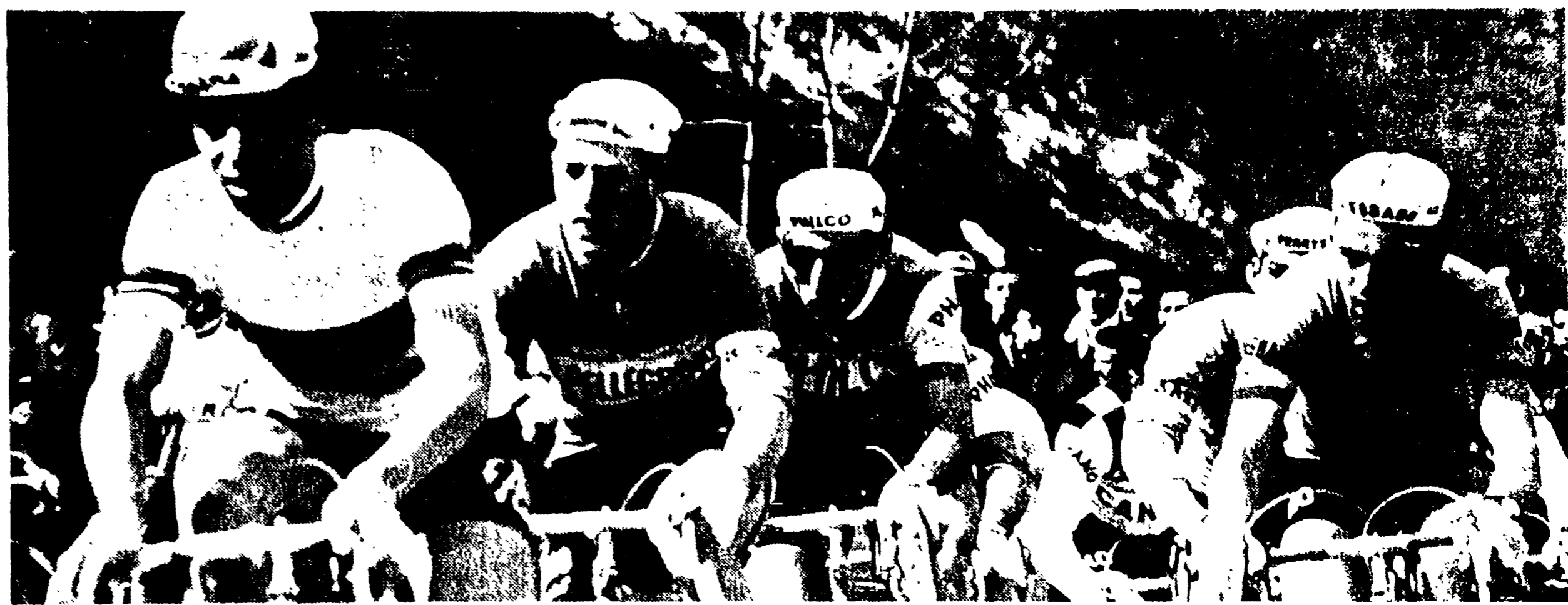
Non è bastato il meraviglioso coraggio di Bailetti - L'elettrica galoppata del belga ha esaltato la corsa - Com'è che i Carlesi, i Defilippis e i Nencini hanno dato un calcio alle loro possibilità. Le infinite risorse della Milano - San Remo