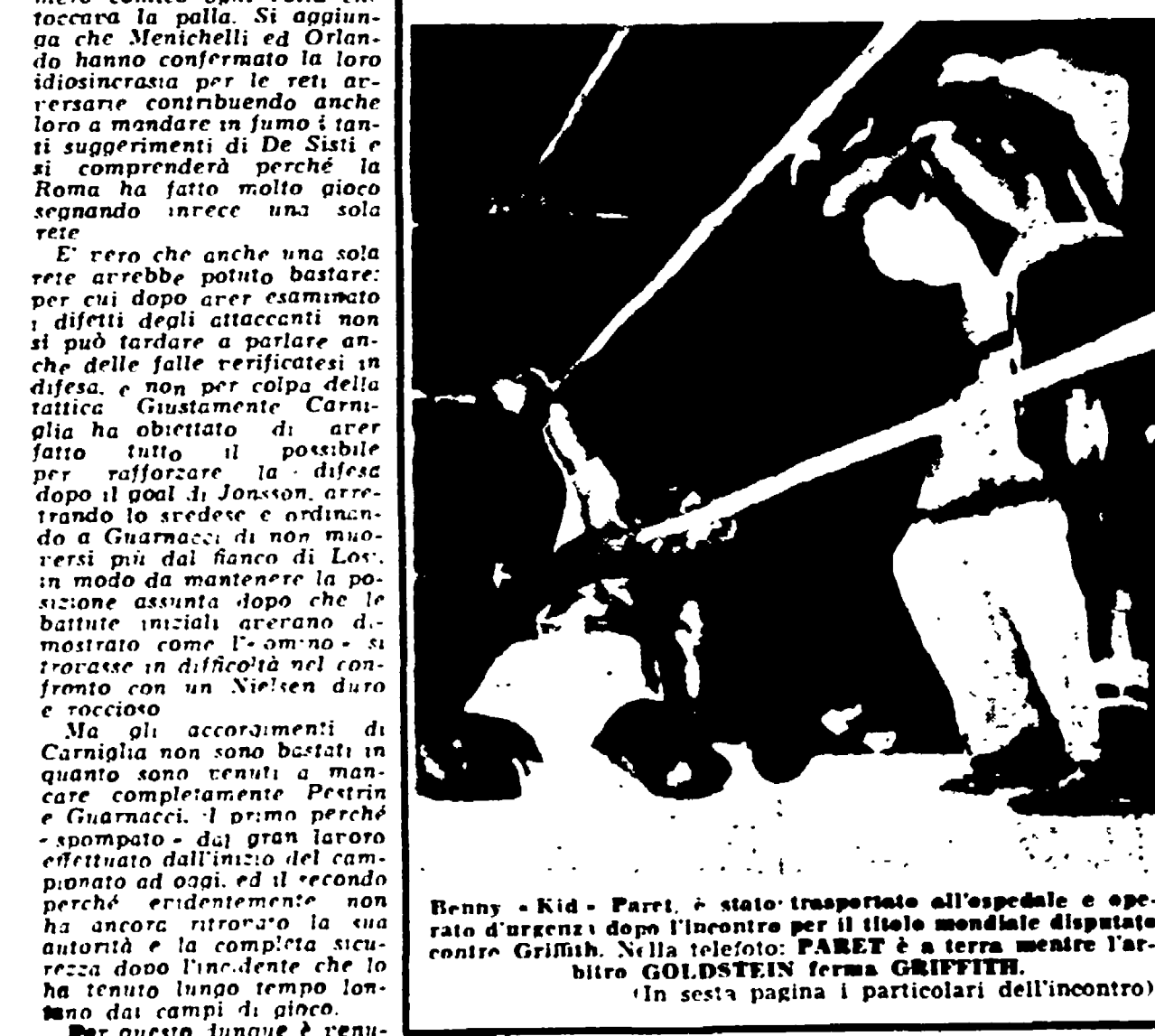
Benny Kid Paret è stato trasportato all'ospedale e operato d'urgenza dopo l'incontro per il titolo mondiale disputato contro Griffith. Nella foto: PARET a terra mentre l'arbitro GOLDSTEIN ferma GRIFITH.