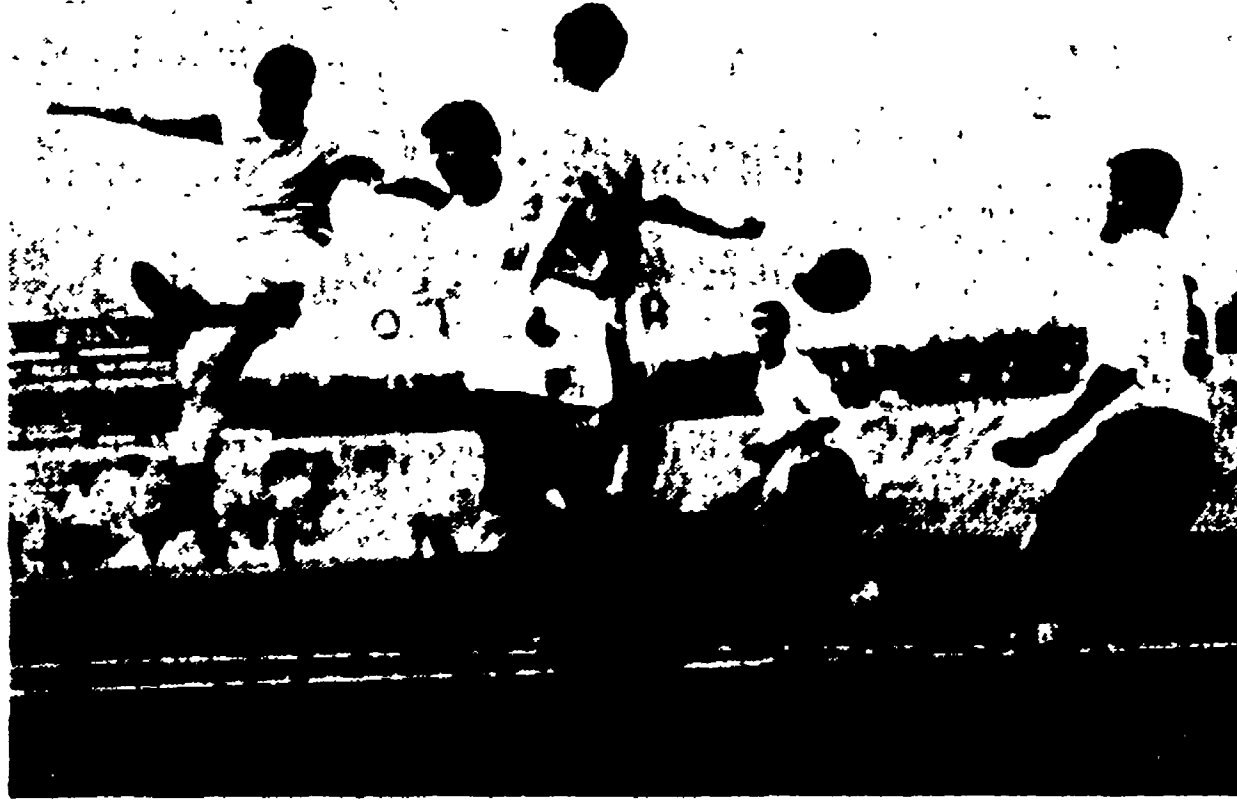
COMO-LAZIO 0-0 - LONGONI si fa luce di testa ma i laziali, molto guardinghi, non si lasciano sorprendere

La Lazio delude anche a Como per la sterilità degli attaccanti. Solo in un paio di occasioni i laziali si sono dimostrati pericolosi.