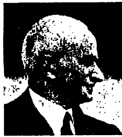
Nell'80° anniversario della nascita esce la raccolta dei quaderni delle famose Prediche inuttili di Luigi Einaudi.

Il libro che occupa il primo posto tra i « best-sellers »: IL GIARDINO DEI FINZI-CONTINI di Giorgio Bassani - 50° migliaio