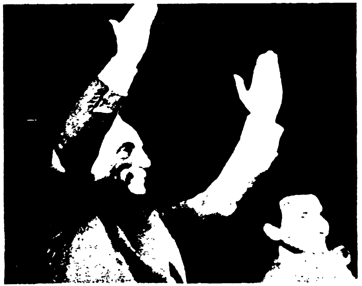
MOSCA, 30 - Eduardo, al termine della trionfale prima di « Questi fantasmi », risponde alle chiamate del pubblico accorso al « Teatro Maly ».

Lo ha detto ad un giornalista, aggiungendo di essere un ammiratore del poeta sovietico - Dichiarazioni di registi e uomini di cultura