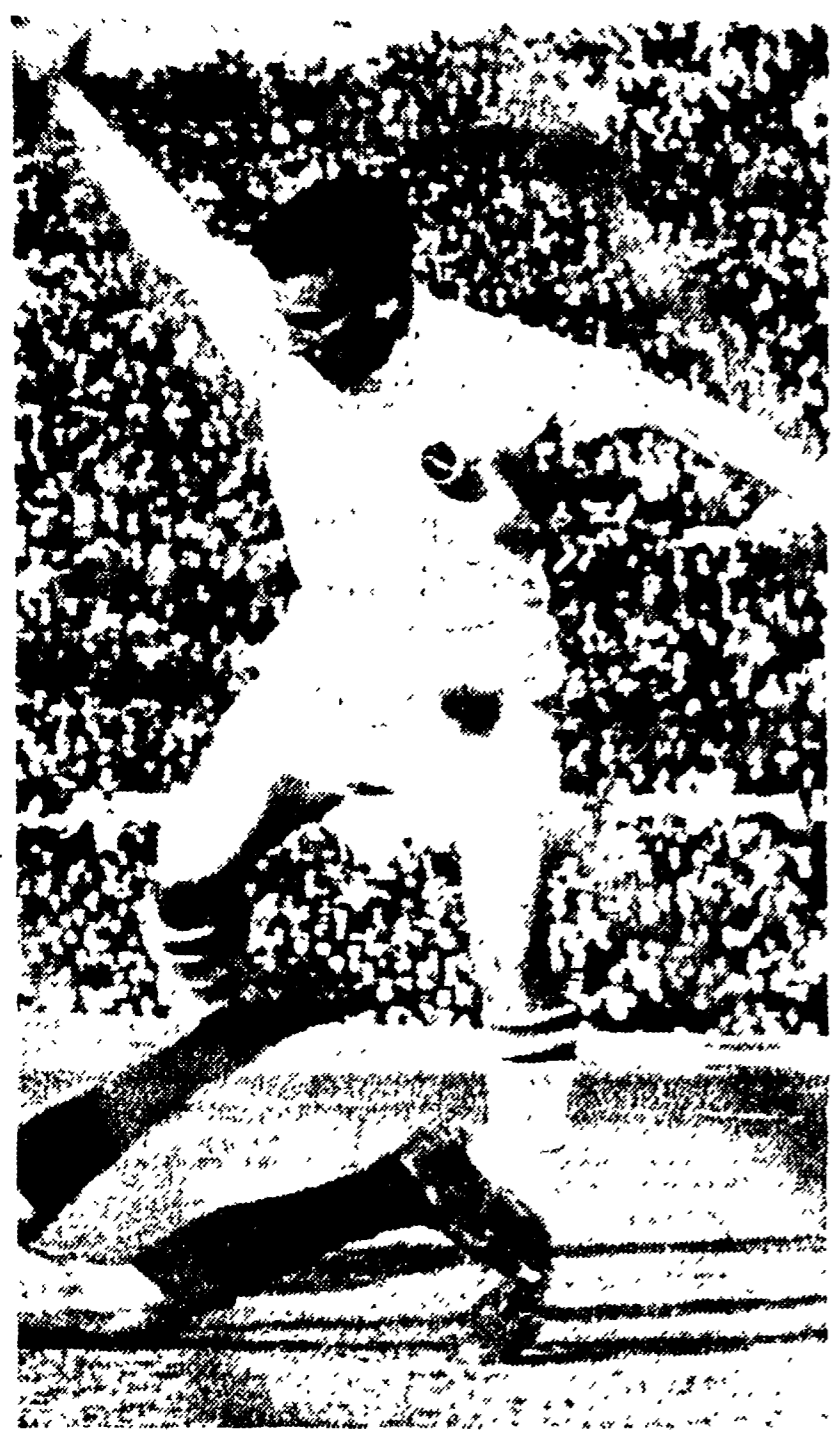
Dopo l'ultima deludente prova di Manfredini oggi rientra Angelillo nelle file della Roma; probabilmente si tratta dell'ultima prova di Angelillo sia per quanto riguarda il suo futuro alla Roma, sia per quanto riguarda il Cile