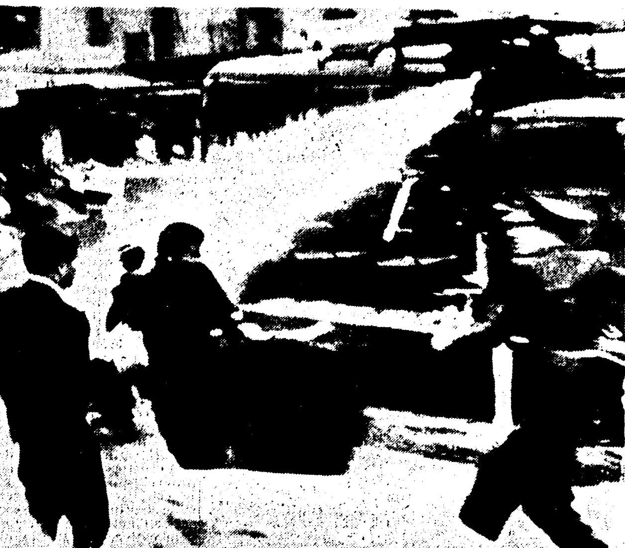
ATENE. — Nuove dimostrazioni antigovernative si sono svolte ieri nella capitale greca. Le manifestazioni hanno assunto un tono ancor più spiccatamente politico di quelle di venerdì scorso. I giovani ateniesi hanno infatti protestato, ieri, non solo contro la disastrosa politica scolastica del governo greco, ma contro le violenze della polizia (che venerdì aveva ferito numerosi giovani) e soprattutto contro il regime antidemocratico e contro la monarchia. Nella foto: i dranti della polizia e manganelli in azione contro i coraggiosi studenti della capitale

Eccezionale impresa all'Istituto di Dubna