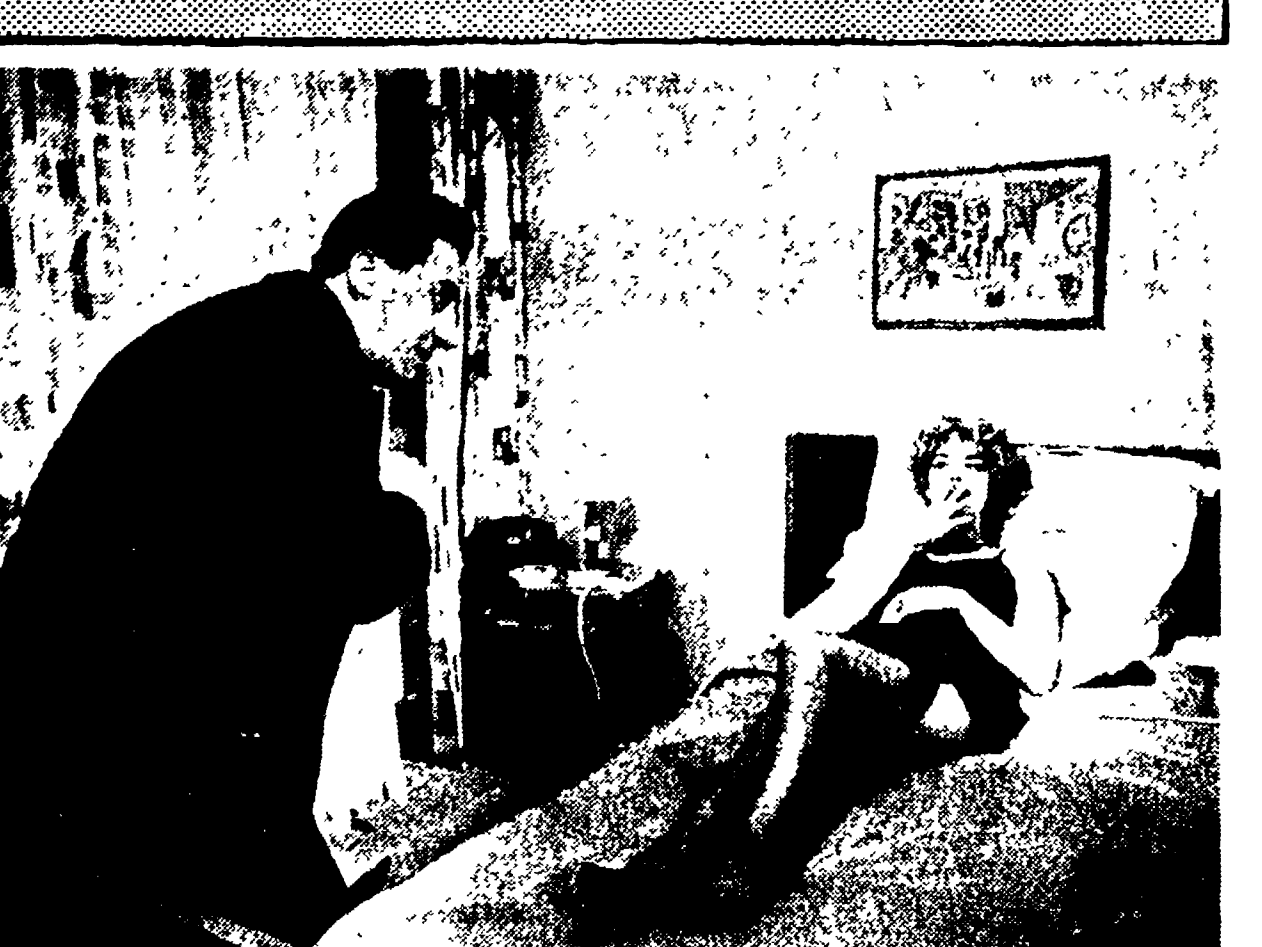
Buona Pasqua a tutti! È questo l'augurio che Alberto Sordi vi purga nel presentare il suo film di Pasqua « IL COMMISSARIO ». È un film giallo, col brivido, comico, sentimentale, moderno, realistico e poliziesco. Narra le vicende di un Commissario arruffato, confusionario, melodico e pigro, ma fondamentalmente buono. In programmazione dal giorno 21 aprile in uno dei principali locali di Roma

« La Gioconda » di G. Puccini. « La Gioconda » di G. Puccini. « La Gioconda » di G. Puccini.