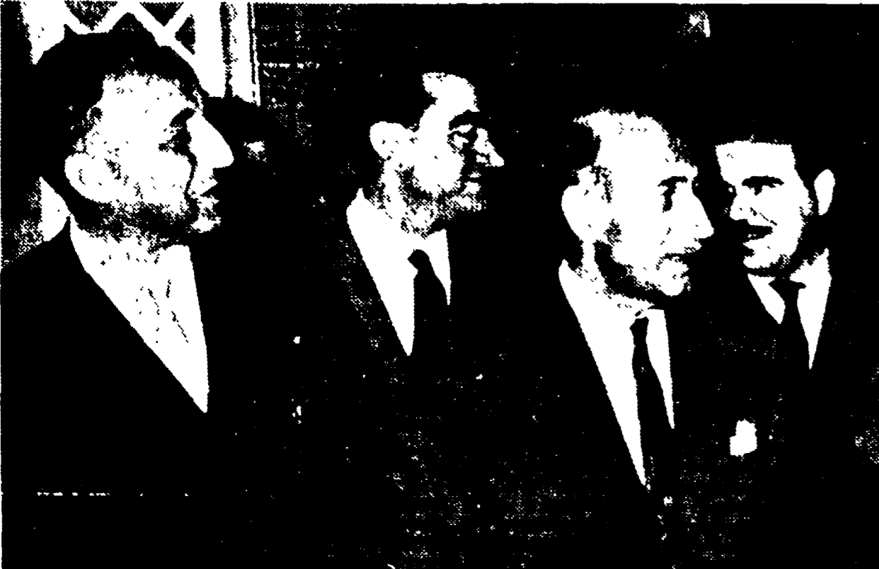
DAMASCO — Il nuovo premier siriano, Bashir Amzeh (a sinistra) insieme con altri ministri del suo gabinetto, nel corso della cerimonia per la sua investitura a premier

Un ex-ministro di Nasser a capo del nuovo governo - I ministri prepareranno la nuova Costituzione