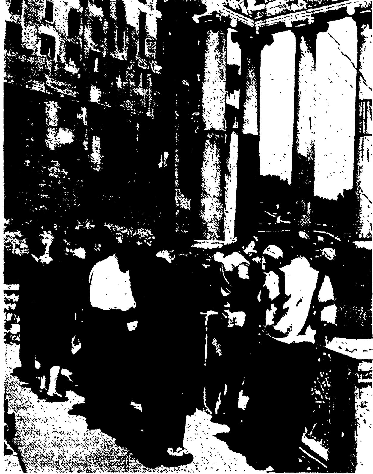
Gli alberghi di Roma sono già quasi tutti esauriti: la foto mostra un gruppo di turisti al Palatino