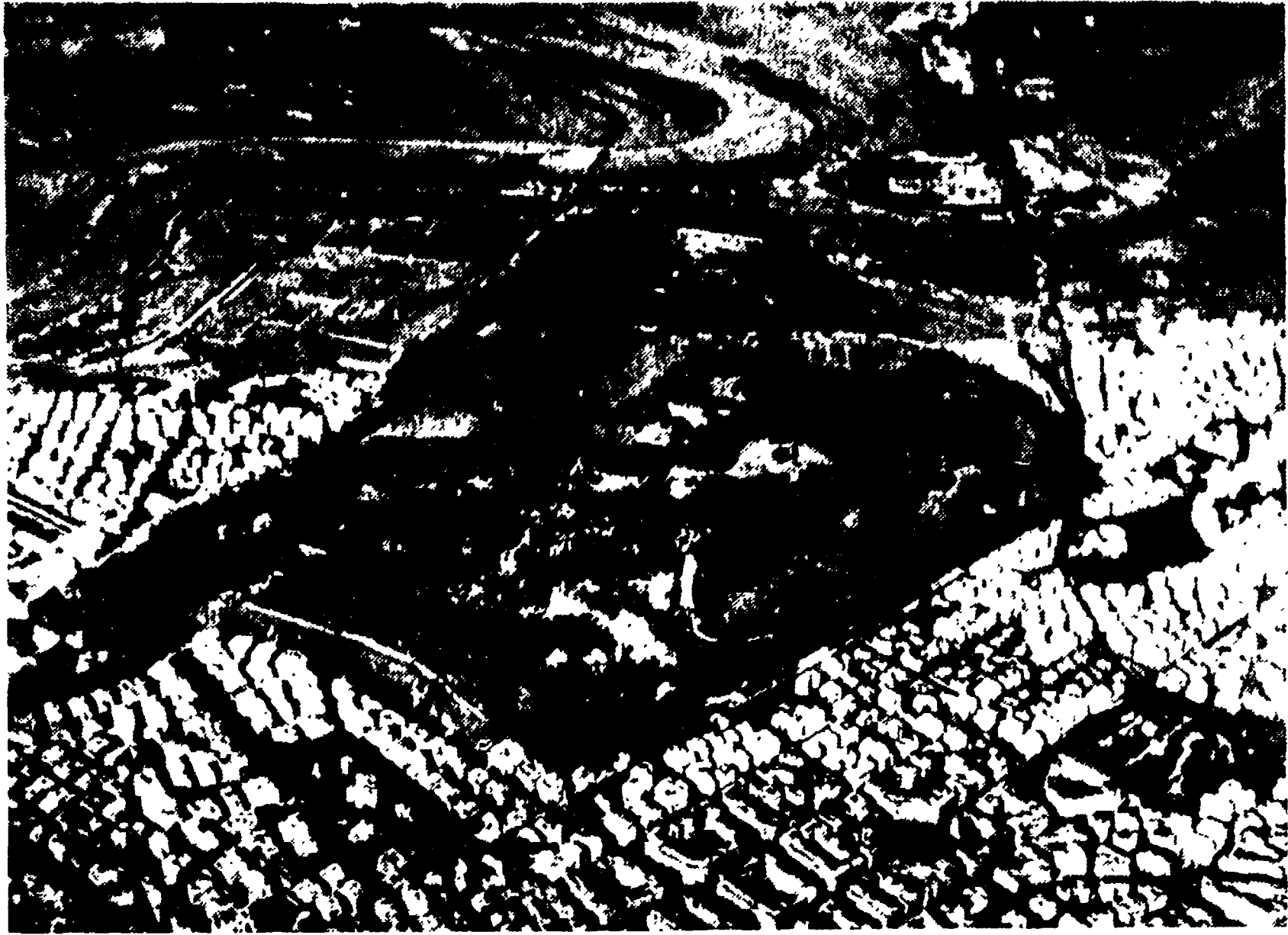
Il comprensorio di villa Ada unica zona verde in un mare di cemento

Un compromesso già stipulato con una grossa società immobiliare - Urge prorogare le norme di salvaguardia del P.R.