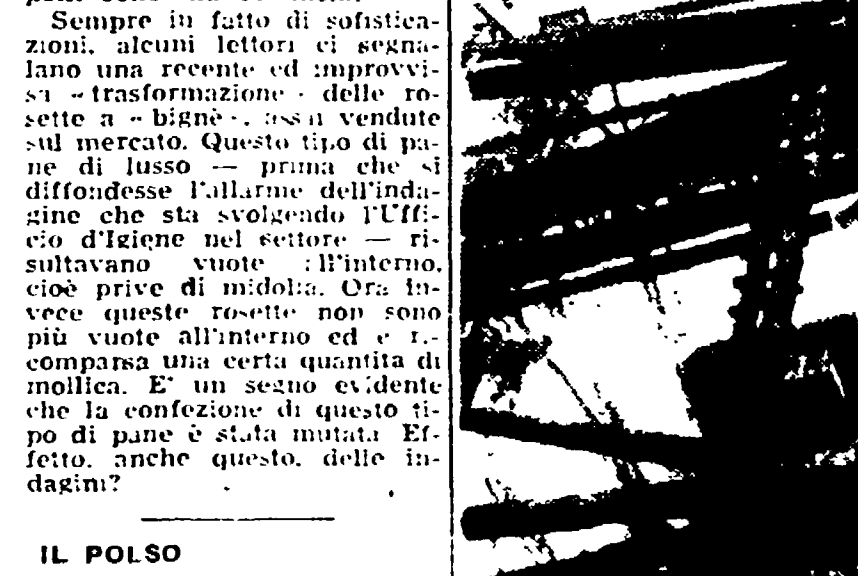
Un giovane operaio è morto ieri mattina, schiacciato da una massa di terra sbracciata dal terrapieno sotto il quale lavorava con una ruspa. Il gravissimo infortunio sul lavoro si è verificato alle 10 nel cantiere dell'impresa Massimini-Puturo, che sta procedendo ai lavori di allargamento della via Aurelia, all'altezza del decimo chilometro.

Un operaio ucciso da una frana Panico per il crollo di un solaio