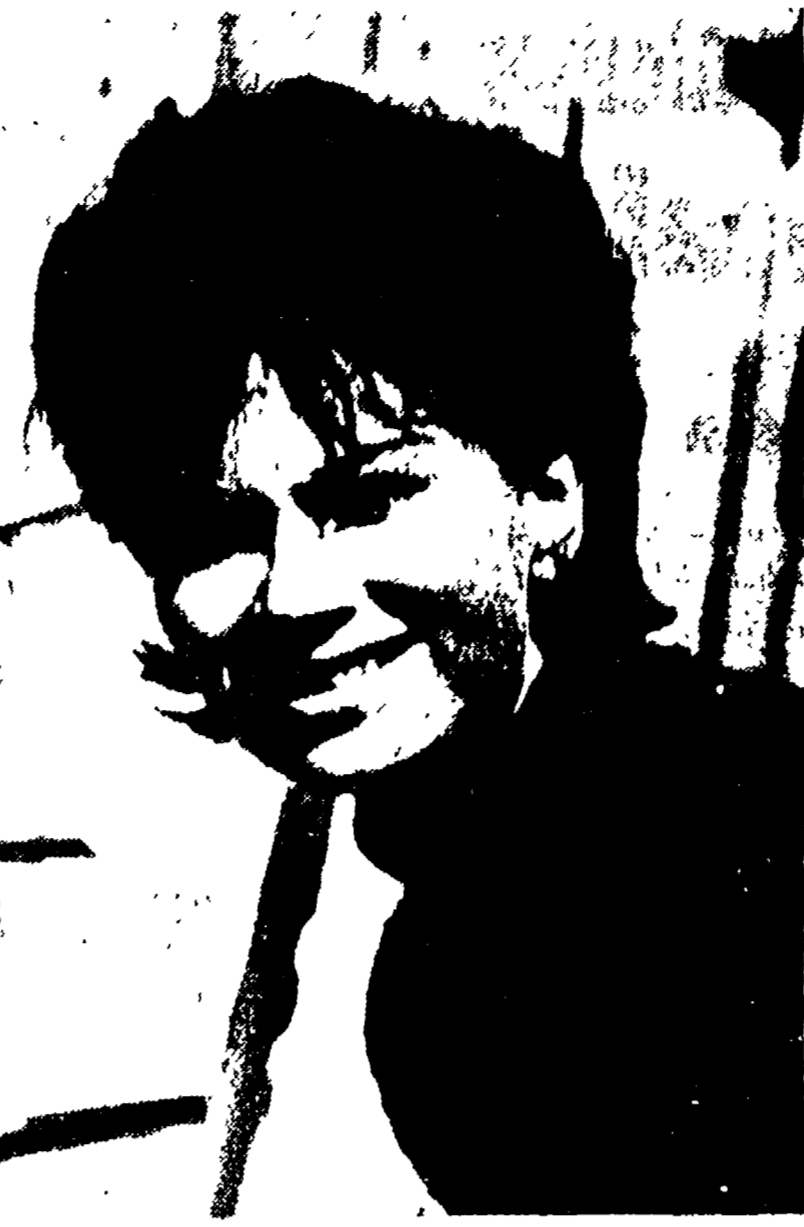
Lea Massari ha iniziato in questi giorni le riprese del film « La città prigioniera ». Avrà al suo fianco, come partner, David Niven e ricoprirà il ruolo di una partigiana.