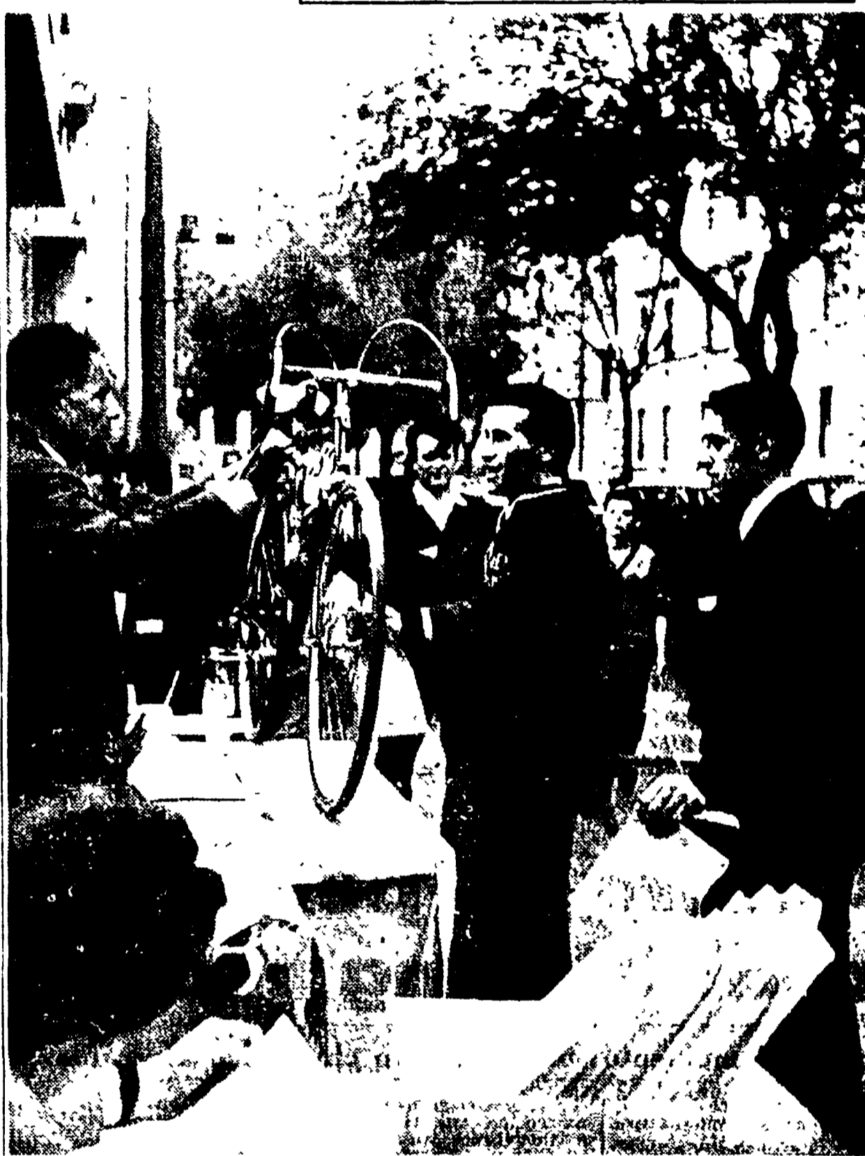
Una fase della panzonata davanti alla sede di «Unità» e di turno MAROCCHI