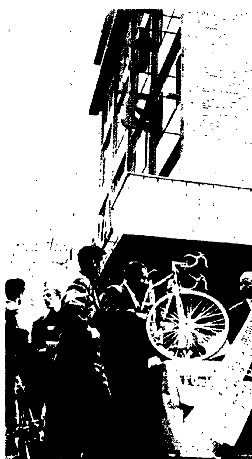
Un'altra fase della panzonata alla quale si sono presentati ben 87 corridori

Stamani, alle ore 8,15, i migliori dilettanti italiani si lanceranno nel XVII Gran Premio della Liberazione, la bella corsa organizzata dal nostro giornale in collaborazione con la Lazio-UN-FIZZ, valevole per l'aggiudicazione del Trofeo UN-FIZZ.