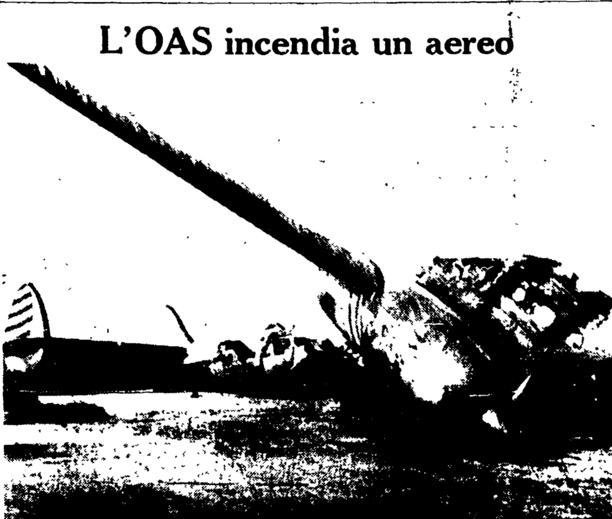
L'OAS incendia un aereo

ta; altri richiedono ulteriori approfondimenti. In questo rapporto d'impostazione generale della discussione, si tratta, ancora, solo di indicare i temi, la base da cui partire. Evidentemente, questa base deve essere quella che siamo venuti definendo e precisando dal IX Congresso ad oggi.