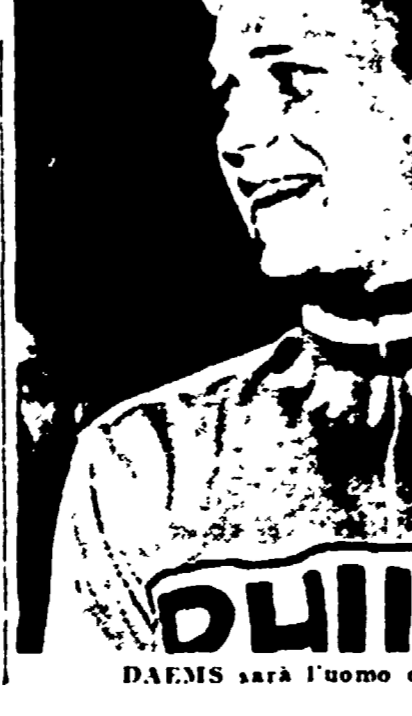
DAEMS sarà l'uomo da battere per Van Looy