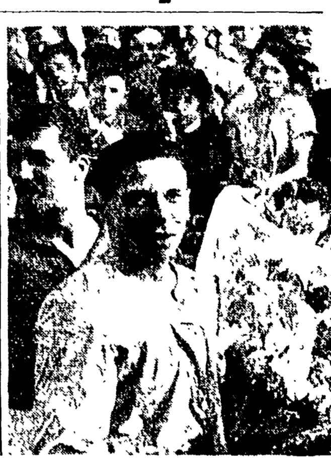
Nella foto a fianco: CLARK

MISTRETT. 28. — Come si prevedeva le «Ferrari» di Hill e Baghetti non sono riuscite a conquistare il primo luogo, ma Hill è riuscito a classificarsi rispettivamente al terzo e quarto posto, dopo aver lottato strenuamente contro i macchine inglesi per tutta la gara. Però c'è da aggiungere che la «Ferrari» non intendeva scoprire apertamente i suoi piani, per questo la sua partecipazione era stata così riservata. Il pilota di Modena aveva cercato di ogni costo una affermazione. Siamo arrivati così alla vigilia delle prove mondiali senza che si potesse avere una idea precisa delle reali possibilità dei nuovi bulli della casa di Maranello: il verdetto era nelle gare valide per il Gran Premio d'Europa. Il comportamento delle «Ferrari» sarà assai diverso.