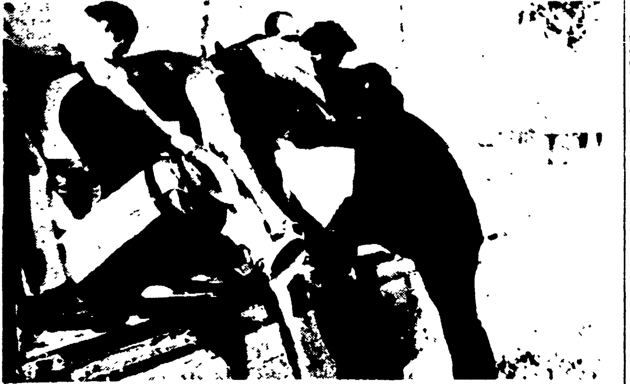
PAVIA — Il movimento degli agricoltori pavesi per i contratti del latte viene spinto dai esordi di azione agraria e della Confagricoltura su posizioni sempre più esasperate. Due ordigni esplosivi sono stati lanciati, nella notte di ieri, all'interno del caseificio Concorso di Villastere mentre le squadre di picchettaggio hanno continuato a intercettare i prodotti « crumiri ». Nella foto: i bidoni del latte di un camion bloccato vengono rovesciati nella strada