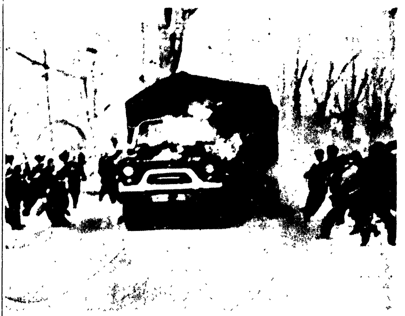
MONTREAL. — Picchetti operai lanciano pietre contro un camion condotto da crumiri e scortato da poliziotti nella città canadese di Montreal, dove è in atto lo sciopero dei lavoratori dei trasporti, i quali reclamano sostanziali aumenti di salario