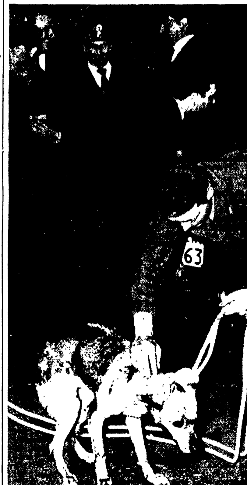
Questo è « Benvenuto ». Qualcuno, l'altra notte, nell'oscurità del quartiere Aurelio, l'ha scambiato per una jena ed ha fatto accorrere squadre di poliziotti e di vigili. Ora il cane — perché di un cane si tratta — dopo aver corso il rischio di morire nella camera a gas del canile comunale, ha trovato tre persone disposte ad adottarlo.