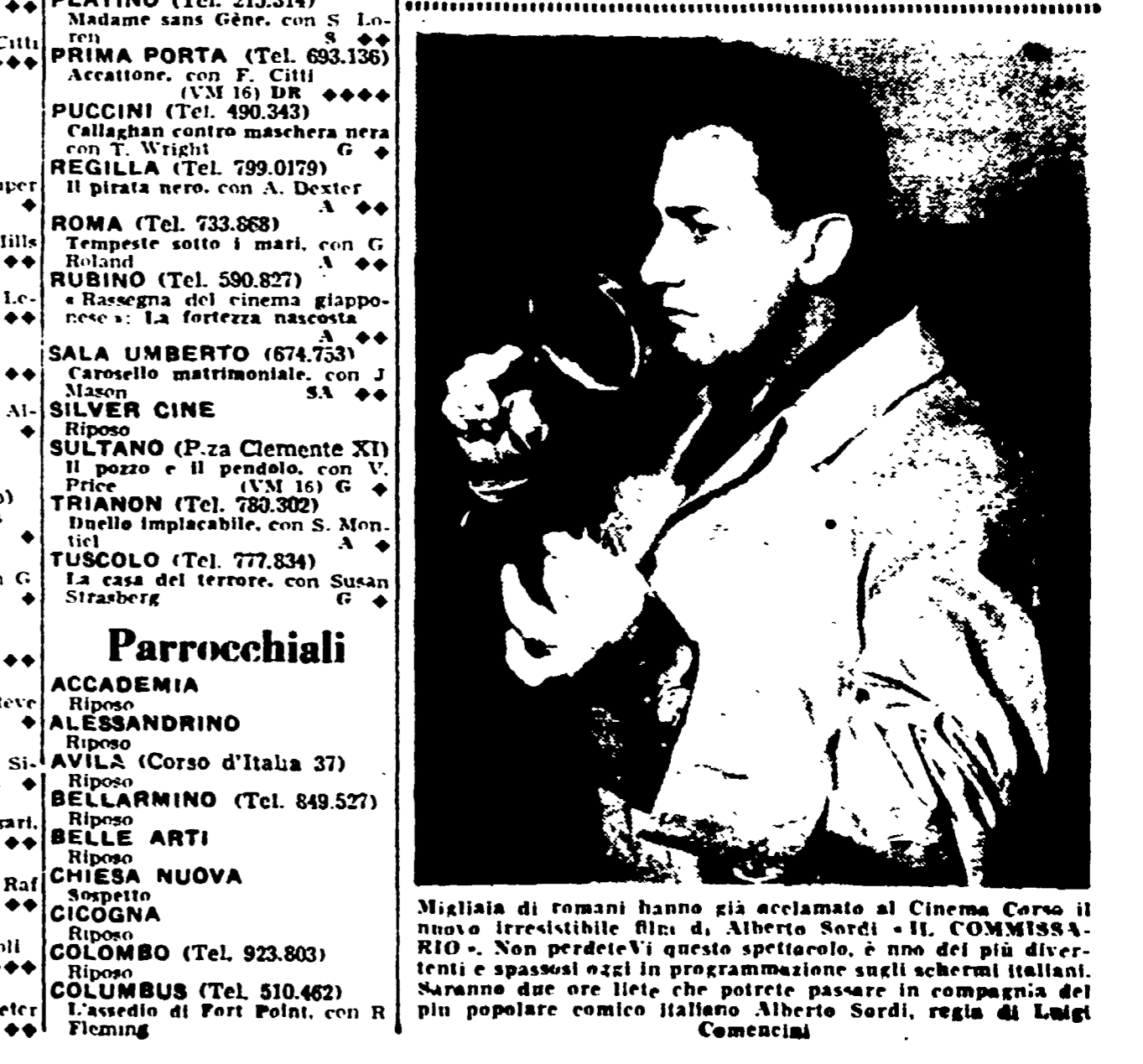
Migliaia di romani hanno già acclamato al Cinema Corso il nuovo irriducibile film di Alberto Sordi «Il COMMISSARIO...»