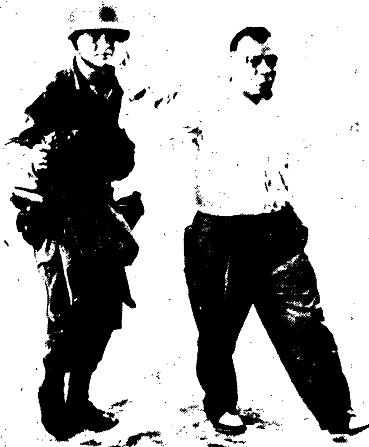
PUERTO CABELLO (Caracas) — Un detenuto politico, liberato durante la rivolta, è catturato nuovamente dalla truppa di Betancourt, viene spinto per il collo da un soldato sotto la minaccia della pistola

Si combatte ancora a Porto Cabello: 400 i morti