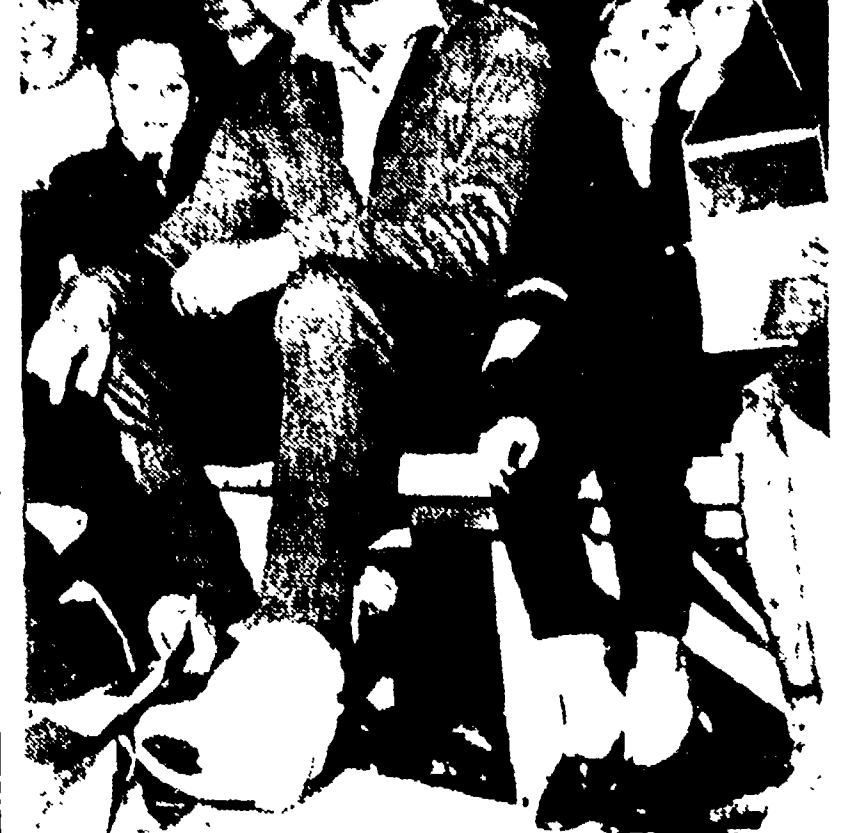
I giornali di Santiago (foto in alto) accusano la stampa italiana di insultare il Cile e di presentare i giocatori azzurri come innocenti angioletti vittime dei selvaggi cileni. Chi ha ragione? Forse può dirlo MASCHIO che la telefoto sotto mostra con la caviglia ingessata, il naso gonfio e un occhio pesto...