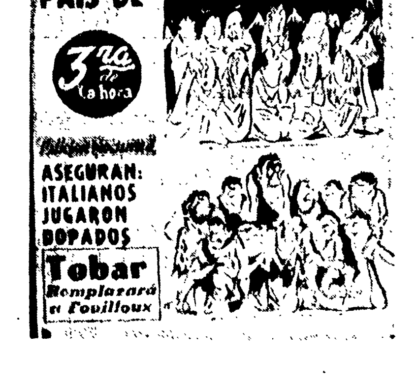
I giornali di Santiago (foto in alto) accusano la stampa italiana di insultare il Cile e di presentare i giocatori azzurri come innocenti angioletti vittime dei selvaggi cileni. Chi ha ragione? Forse può dirlo MASCHIO che la telefoto sotto mostra con la caviglia ingessata, il naso gonfio e un occhio pesto...